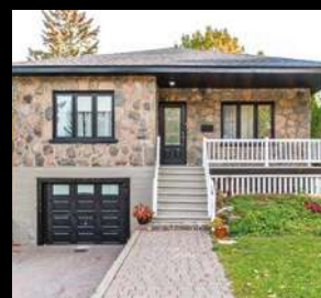
SILLERY 379 000$ 1130, avenue Maguire