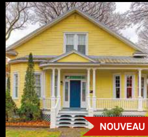
SILLERY 579 000$ 1241, avenue des Grands-Pins