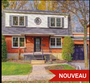
ST-SACREMENT 599 000$ 1356, rue de Callières