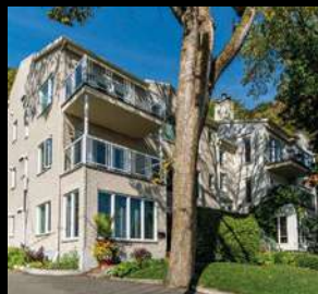
SILLERY 329 000$ 1837-2, côte de Sillery