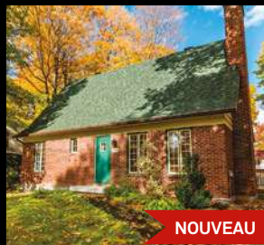
CAP-ROUGE 374 500$ 1029, rue d'Armentières