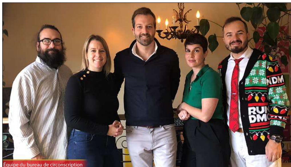
Équipe du bureau de circonscription

En ce temps des Fêtes, que la joie, l'amour et le ressourcement soient au rendez-vous.