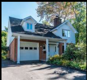
SILLERY 689 000$ 2025, rue Maire-Roche