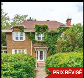
SILLERY 829 000$ 902, Grande Allée Ouest