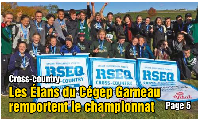
Cross-country Les Élans du Cégep Garneau remportent le championnat