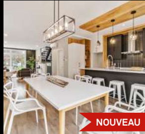
SILLERY à partir de 485 000$ +tx 1853, rue de Bergerville