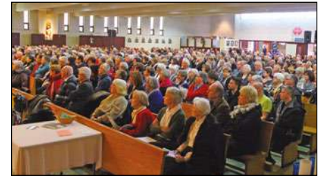
Photo prise lors de l'édition 2018 du concert de Noël de l'Ensemble classique a piacere.

Guignolée de la SSVF Conférence Saint-Louis-de-France — Saint-Yves