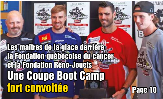
Les maîtres de la glace derrière la Fondation québécoise du cancer et la Fondation Réno-Jouets Une Coupe Boot Camp fort convoitée