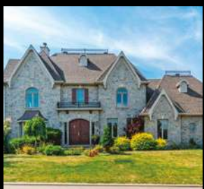
CAP ROUGE 1 099 000$ 1156, rue Jean-Charles-Harvey