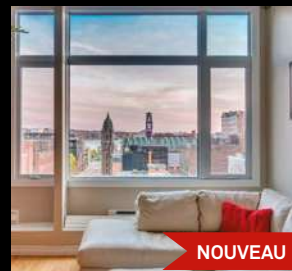
VIEUX-QUÉBEC 389 000$ 125-516, rue Dalhousie