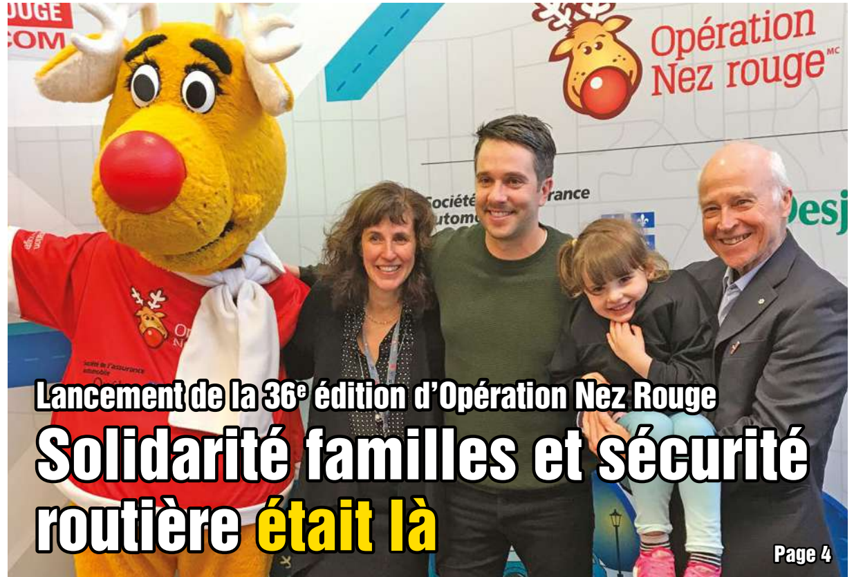
Lancement de la 36 e édition d'Opération Nez Rouge Solidarité familles et sécurité routière était là