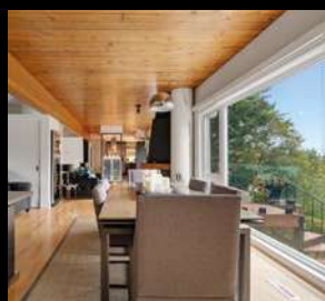
ST-LOUIS 1 279 000$ 2785, rue de l'Anse