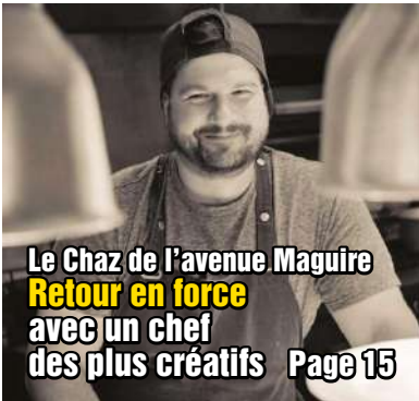
Le Chaz de l'avenue Maguire Retour en force avec un chef des plus créatifs