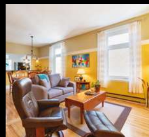
MONTCALM 269 000$ 720-6, rue Père-Marquette