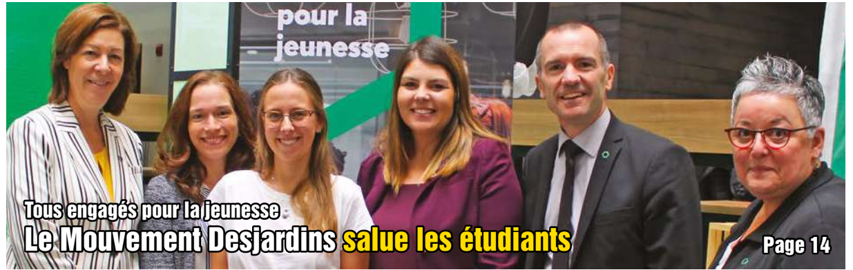
Tous engagés pour la jeunesse: Le Mouvement Desjardins salue les étudiants