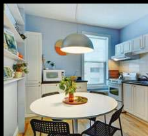
MONTCALM 144 900$ 370-4, chemin Ste-Foy