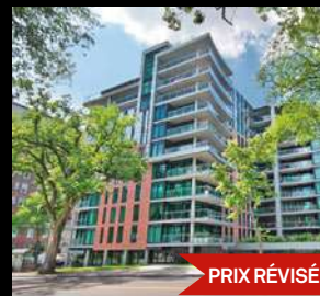
ST-JEAN-BAPTISTE 539 000$ 1175-823, avenue Turnbull