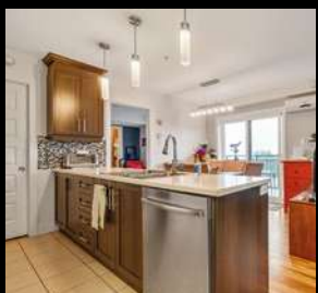
STE-FOY 269 000$ 3124-301, chemin Ste-Foy