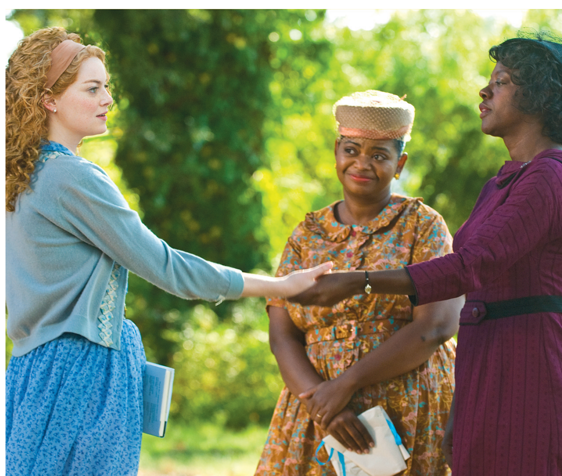
Emma Stone, Octavia Spencer et Viola Davis dans La Couleur des sentiments

Suit une autre nouveauté: Our idiot brother de Jesse Per-