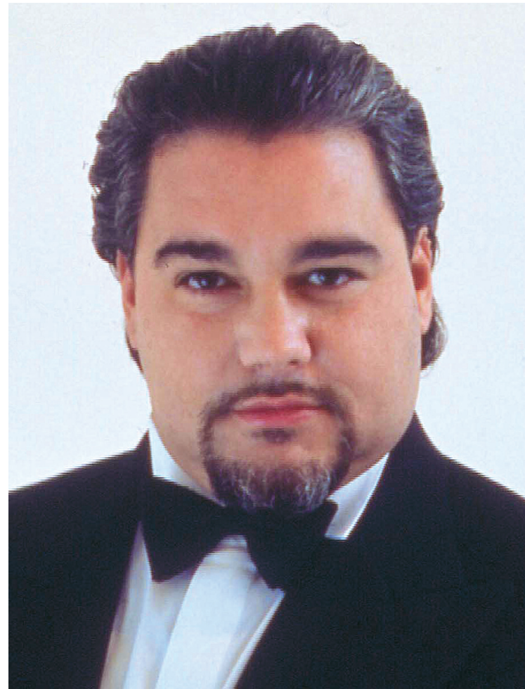
Le ténor italien Salvatore Licitra