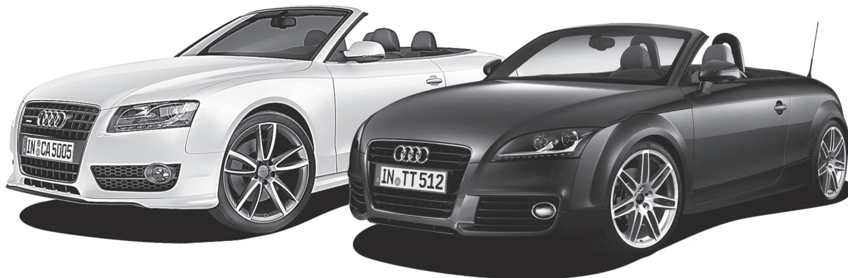
Audi A5 Cabriolet 2011†

Taux également offert sur les modèles A4, A8, Q7 et TT Coupé 2011.