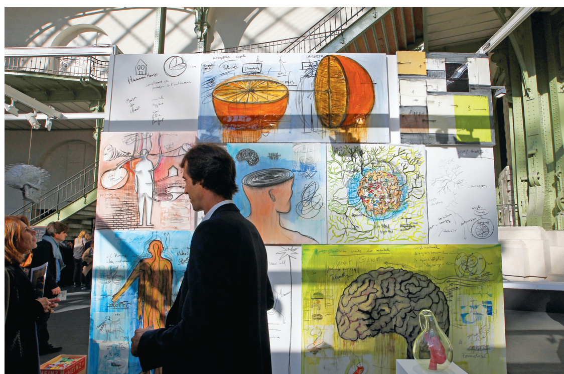
Une œuvre de Fabrice Hyber présentée l'an dernier à la Foire internationale d'art contemporain, au Grand Palais, à Paris.

Rencontré la veille de son retour à Paris, Fabrice Hyber a apprécié ses visites de la Société des arts technologiques et d'Hexagram, centre de recherche en arts médiatiques. Il y a trouvé des gens «positifs», comme Luc Courchesne et