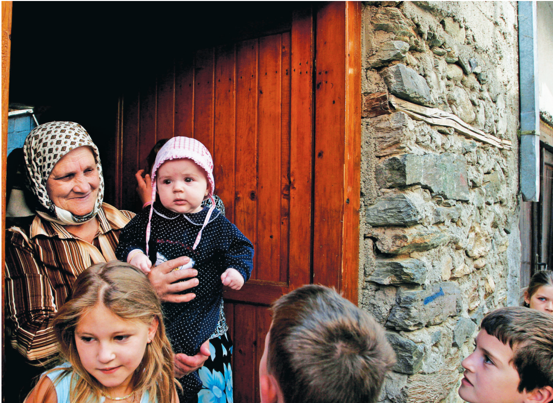
Une famille prend part au festival des circoncisions à Lubinje, à la frontière du Kosovo et de la Macédoine.