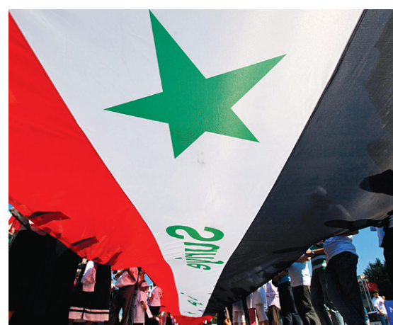
MURAD SEZER REUTERS

Manifestation d'opposants syriens hier à Istanbul