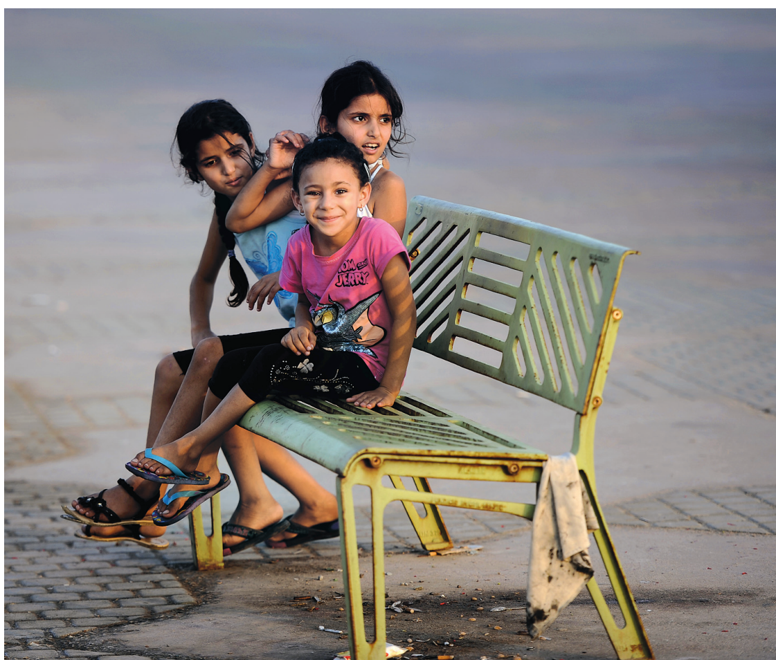
Trois enfants sur un banc de la corniche de Tripoli, samedi: la vie revient lentement à la normale.