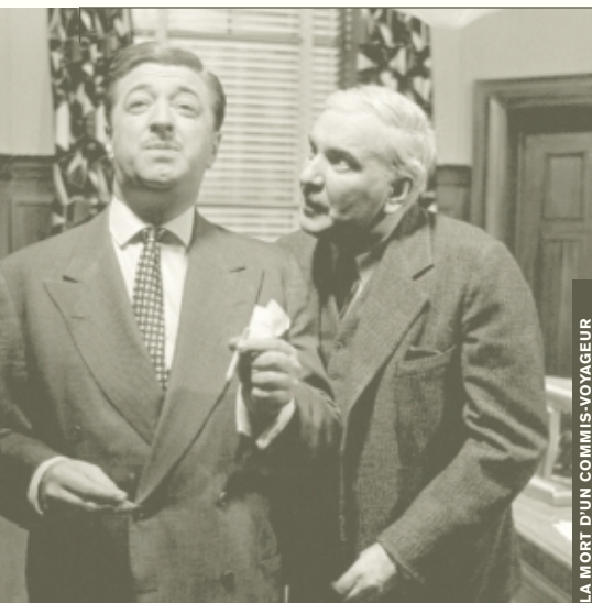
LA MORT D'UN COMMIS-VOYAGEUR