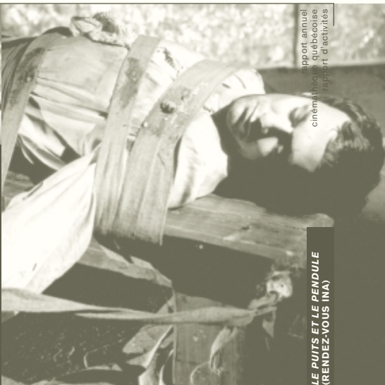
LE BUIX ET LE BENDULE (RENDEZ-VOUS INA)