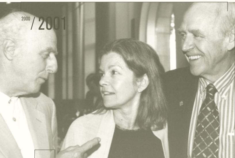
GILLES VIGNEAULT, GENEVIÈVE BUIJOLD ET PAUL ALMOND