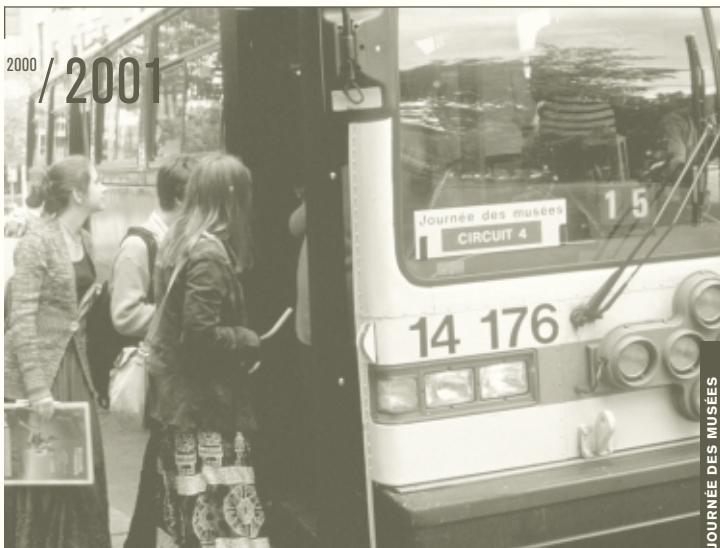
JOURNÉE DES MUSÉES

Quelques institutions ont aussi enrichi nos collections. L'ICAIC a profité de l'hommage rendu à deux acteurs cubains pour nous donner 40 affiches lithographiées. La Société pour le développement des entreprises culturelles a enrichi nos archives de 16 boîtes de scénarios. Mais la plus imposante donation provient de la Corporation CinéGroupe : elle est constituée de quelque 11 500 dossiers qui comprennent des milliers de dessins, de celluloses, de scénarimages, d'arrière-plans, de maquettes, bref de tout ce qui touche à la réalisation de films d'animation. Elle couvre plusieurs séries dont Bino fabule , David Copperfield , Les Aventures de Spirou et Fantasio , Sharky and George et La Bande à Ovide .