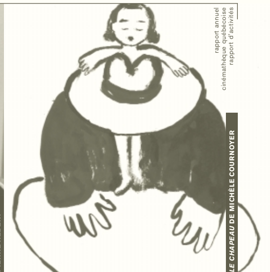
rapport annuel cinémathèque québécoise rapport d'activités