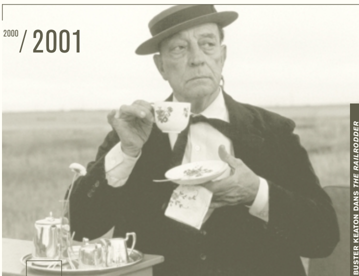
BUSTER KEATON DANS THE RAILRODDER