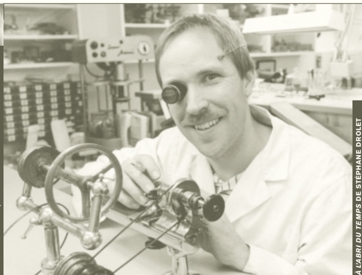
À L'ABRI DU TEMPS DE STÉPHANE DROLET