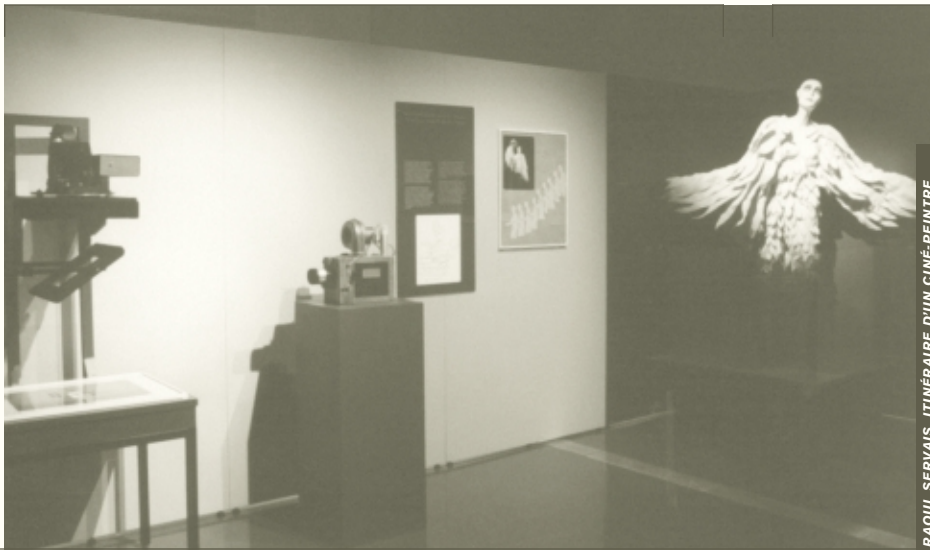
RAOUL SERVAIS, ITINÉRAIRE D'UN CINÉ-PEINTRE

périodiques de cette année se sont effectuées sur des bordereaux temporaires en attendant de pouvoir effectuer une vraie saisie informatique. Par ailleurs, encore cette année, le service à la clientèle a vu ses usagers effectuer leurs recherches dans l'ancienne base de données qui n'a pas été mise à jour depuis 1997.