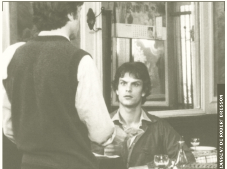
L'ARGENT DE ROBERT BRESSON