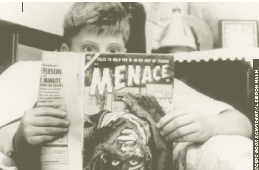
COMIC BOOK CONFIDENTIAL DE RON MANN