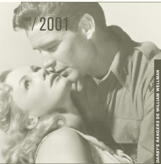
DARBY'S RANGERS DE WILLIAM WELLMAN