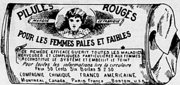
Fac-similé exact d'une boîte de Pilules Rouges.

Nos Pilules Rouges sont une spécialité pour les maladies des femmes seulement ; c'est ce qui fait leur force et leur popularité. Il est impossible à un remède de guérir tous les maux. Jamais, dans l'histoire de la médecine, un remède n'a obtenu autant de guérisons que nos Pilules Rouges. Nous demandons à nos nombreuses clientes de ne pas comparer nos Pilules Rouges aux autres remèdes guérissant tous les maux, entre autres, aux remèdes liquides qui ne doivent leur effet stimulant qu'à l'alcool qu'ils renferment.