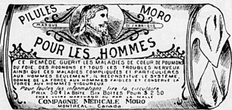
Fac-Simile exact d'une boîte de Pilules Moro.

Donnez-nous un homme brisé par les excès, la dissipation, un travail trop dur, les tracas, ou par toute autre cause qui ait sapé sa vitalité, avec les Pilules Moro nous le rendrons aussi vigoureux en tous points, que n'importe quel homme de son âge.