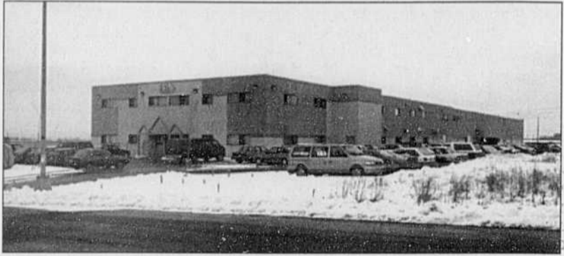
L'usine de Saint-Augustin-de-Desmaures, dans la région de Québec.

La croissance fut donc très rapide, faite de déménagements et agrandissements fréquents. Après cinq ans, commençaient les exportations aux États-Unis. Avec l'essoufflement du marché des vêtements cyclistes, M. Garneau mise sur les casques avec l'objectif de fabriquer les meilleurs au monde, un titre qui lui a été reconquis l'an passé en Allemagne. Il est lui-même le concepteur de tous ses casques. «Pour moi, c'est de la sculpture», dit-il.