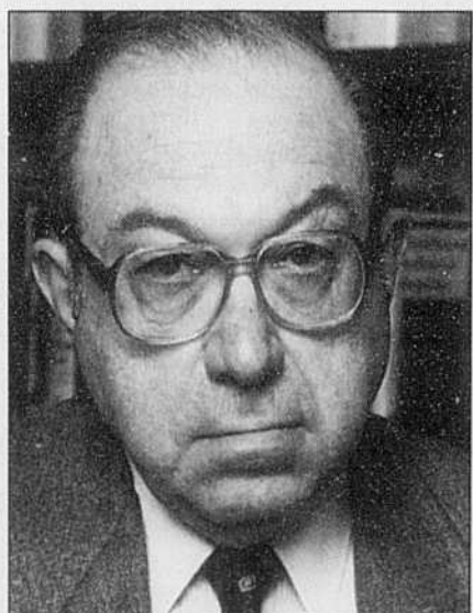
Hilberg a consacré 40 ans de sa vie à chercher.