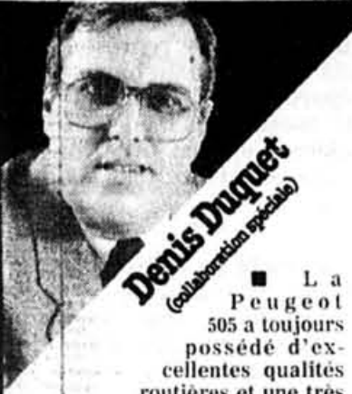
Denis Duquet (collaboration spéciale)

La Peugeot 505 a toujours possédé d'excellentes qualités routières et une très bonne habitabilité. Cependant, au cours des années, il était devenu monnaie courante de critiquer le manque de vigueur de son moteur. En effet, même si les performances n'étaient pas si mauvaises qu'on le disait, elles ne pouvaient se comparer à celles d'autres voitures de même catégorie. L'an dernier, Peugeot remédiait à cette situation en offrant un moteur turbocompressé. Cette année, ce moteur de 2,2 litres turbo profite d'un refroidisseur d'air qui porte sa puissance à plus de 160 chevaux. De plus, une nouvelle boîte automatique à quatre rapports est également offerte. Reste à voir si les améliorations sont perceptibles.