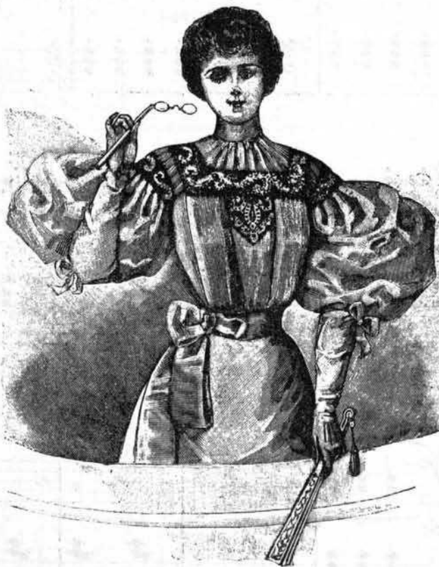
Blouse pour le théâtre.

Enfin voici le grand jour : " le plus beau de la vie ! " Indiquons ra-