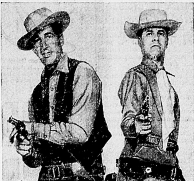
Dean Martin et Jerry Lewis, dans leur premier Western intitulé "Partners", présentement à l'affiche au Ciné Maska, et ce jusqu'à vendredi. Saviez-vous que le théâtre Maska était ouvert en matinée tous les jours de la semaine?