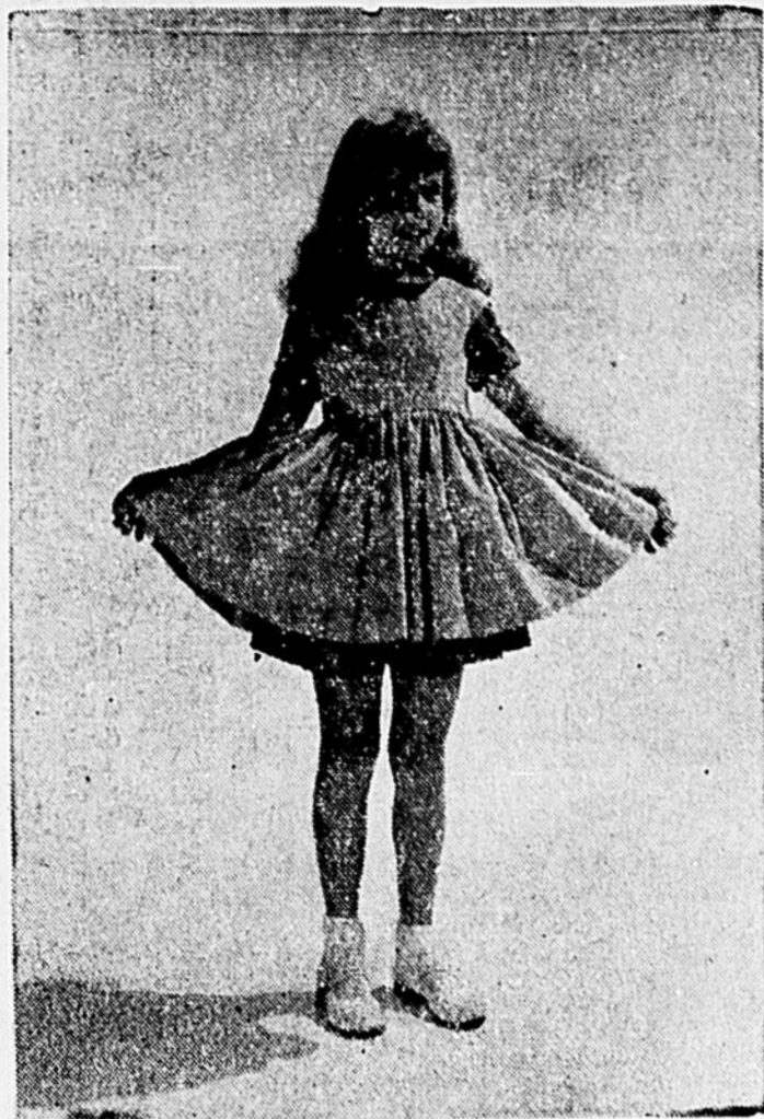
Qualité et style font la joie des écoliers canadiens lorsque leurs vêtements sont fabriqués de tissus canadiens. Cette robe "Text-made" en tartan "Val-mar" authentique peut être portée avec ou sans le tablier fait de broadcloth Coronet.