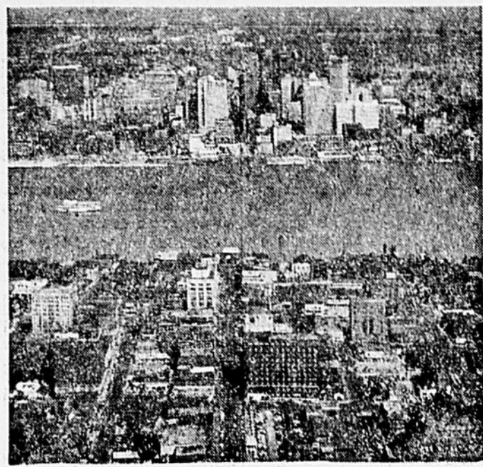
Vue à vol d'oiseau de la ville de Windsor, Ontario, où se déroulera le congrès annuel de la Société Richelieu les 5, 6 et 7 octobre prochains. Au delà de la rivière Détroit: les gratte-ciel de la ville de Détroit.

Dans dix ans, la Société Richelieu, vouée au soulagement des enfants malheureux, a forgé une chaîne de quelque 90 clubs Richelieu à travers le Canada. Elle compte aussi un groupe actif à Manchester, N.-H., son premier club sur le sol américain.