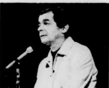
Jeudi: Serge REGGIANI