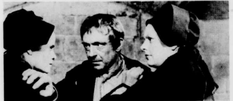
Le très beau drame religieux de Jean Delannoy, «Dieu a besoin des hommes», sera présenté à Ciné-nuit , vers 1 h 20 du matin. Réalisé d'après le roman d'Henri Queffelec «Un recteur de l'île de Sein», le film met en vedette Pierre Fresnay, Madeleine Robinson et Andrée Clément.