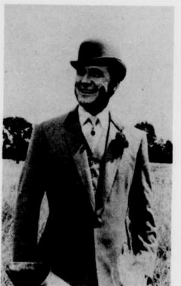
«Chapeau melon et bottes de cuir», le mercredi à 23 h 40.