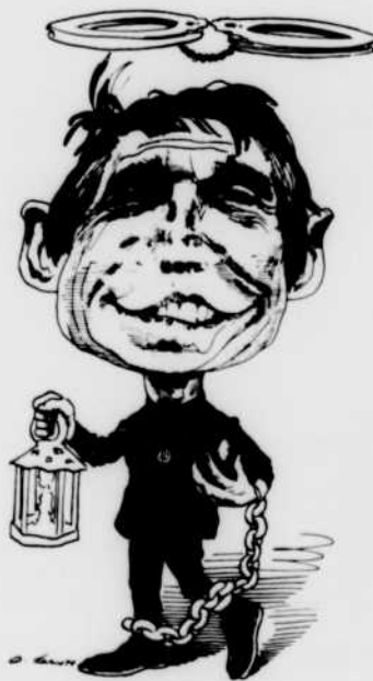
Un saint hors la loi vu par un humoriste.

Sous le titre de Désobéissance divine , la télévision de Radio-Canada présentera en reprise, à 17 heures, une partie de l'émission 5 D , réalisée par Roger Leclerc sur l'aventure spirituelle des «Saints hors la loi», c'est-à-dire des frères Daniel et Philippe Berrigan, les deux premiers prêtres américains «prisonniers politiques» de toute l'histoire des Etats-Unis.