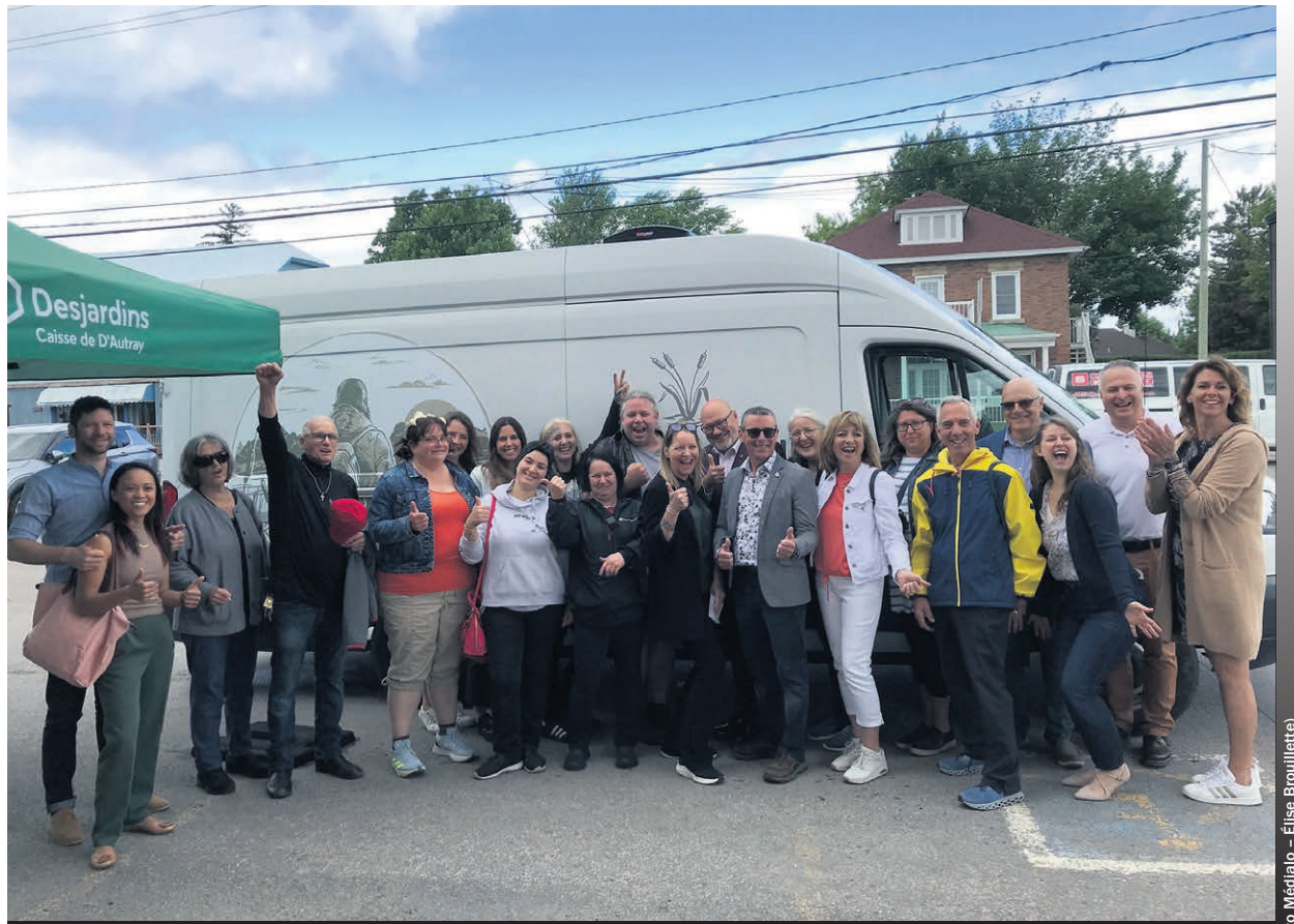
Les acteurs et les partenaires de ce projet majeur.