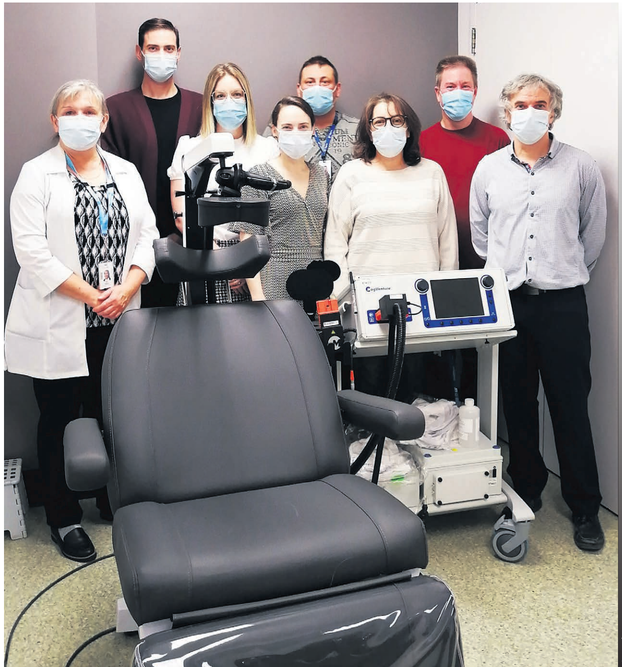
Le traitement donné par l'équipe du service de neuromodulation n'est offert qu'aux personnes qui ont des dépressions réfractaires.