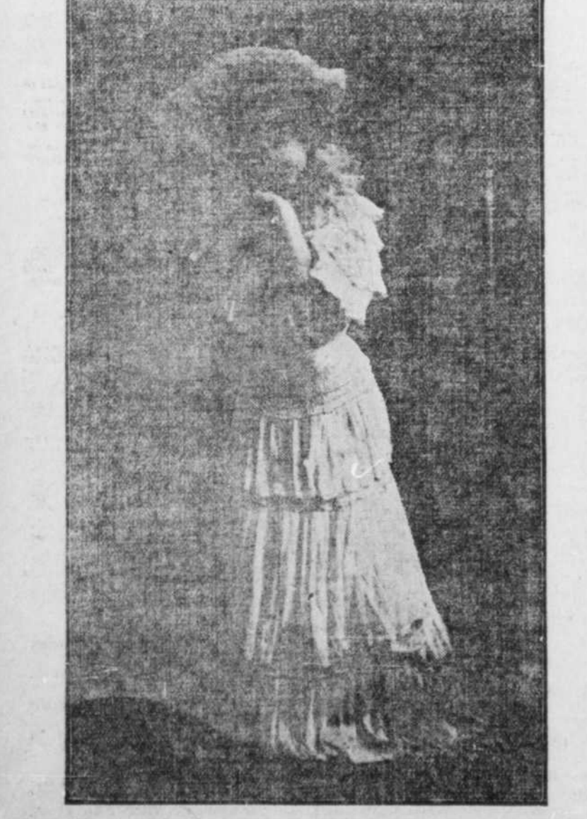
Cette élégante et fraîche toilette, chapeau compris, est toute en linon de soie rose perle. Les volants, de même que le chapeau, sont plissés sur cordonnets.