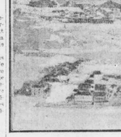
VUE GENERALE DE LA VILLE DE BUTTE, MONTANA, OU LE FEU VIENT DE CAUSER POUR PLUS DE $1,000,000 DE DOMMAGES.

Ce n'est qu'en arrivant ici qu'elle eut la douloureuse certitude qu'elle n'avait pas été trompée.