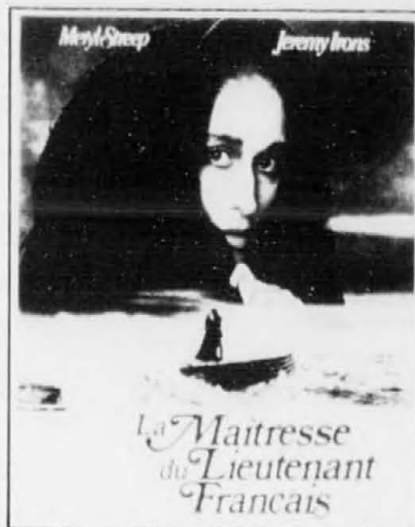
La Maitresse du Lieutenant Français

"Du hockey en direct" LES NORDIQUES VS LES DEVILS DU NEW JERSEY Le 12 janvier à 19h30