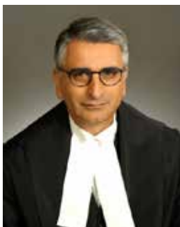
Mahmud Jamal nommé à la Cour suprême du Canada

La Faculté de droit est heureuse d'annoncer que l'honorable Mahmud Jamal, BCL'93, LLB'93, a été nommé à la Cour suprême du Canada. Le juge Jamal remplacera le juge Rosalie Abella, LLD'99, qui prendra sa retraite le 1er juillet 2021.