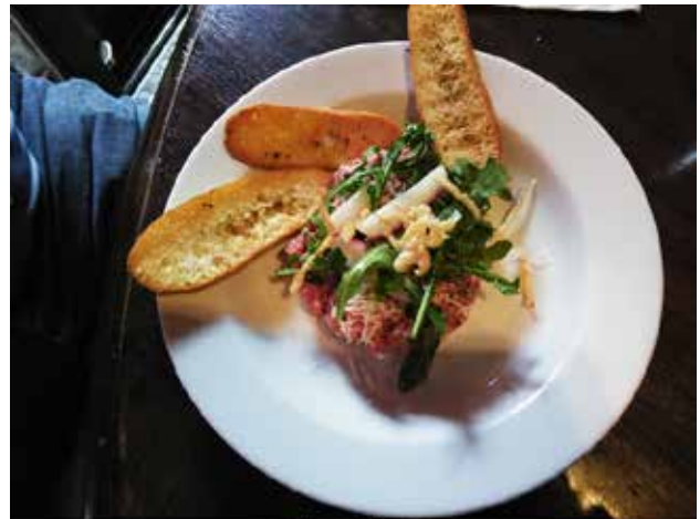
Tartare de boeuf