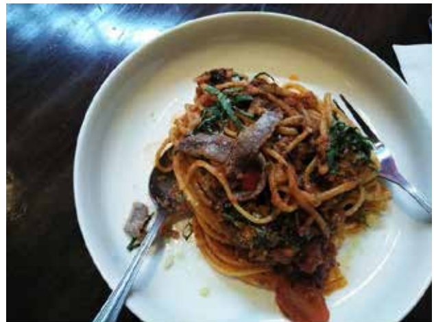
Linguini a la Putanesca