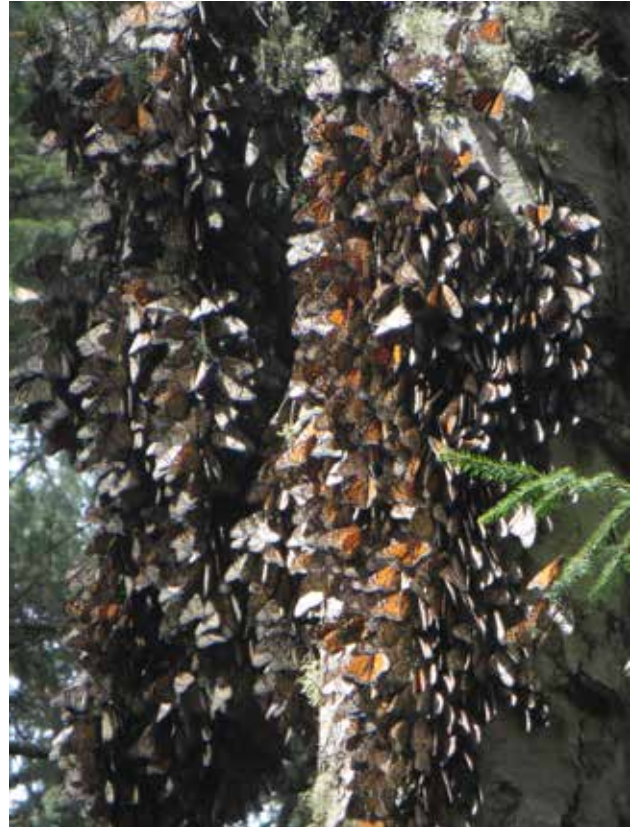
Monarques recouvrant un arbre

Piedra Herrada. (19°10'23.25"N 99°57'33.40"W) C'est le sanctuaire le plus près de la ville de Mexico et c'est dans l'état de Mexico. N'y allez pas la fin de semaine. En fait n'allez à aucun sanctuaire ou musée ou lieu de vacance la fin de semaine. C'est la foule en délire. En fin d'avant-midi ou début d'après-midi, vous pouvez voir les papillons qui descendent de la montagne pour se nourrir et boire. À moins d'être en grande forme, je vous recommande de louer un cheval pour monter et descendre la montagne. Si vous arrivez assez tôt, vous les verrez couvrant les arbres. Littéralement. Il y en a des millions. À noter, les papillons qui viennent de la province de Québec migrent au Mexique. On peut facilement prouver ceci en leur parlant en français qu'ils comprennent.