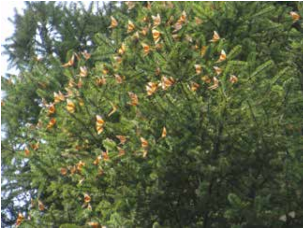
Monarques dans les feuilles.