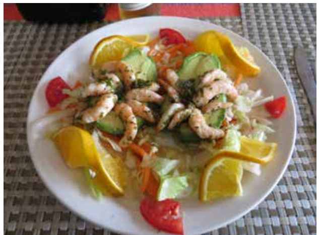
Assiette de crevettes