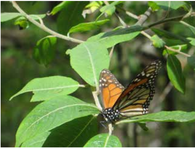
Un seul monarque. Rare!