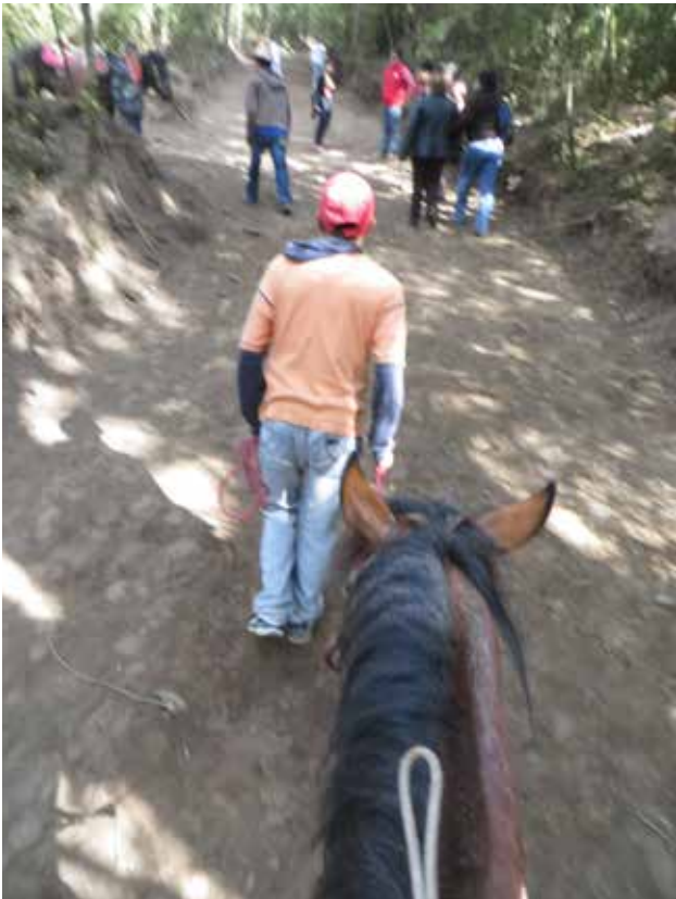
Et oui! J'ai pris un cheval.