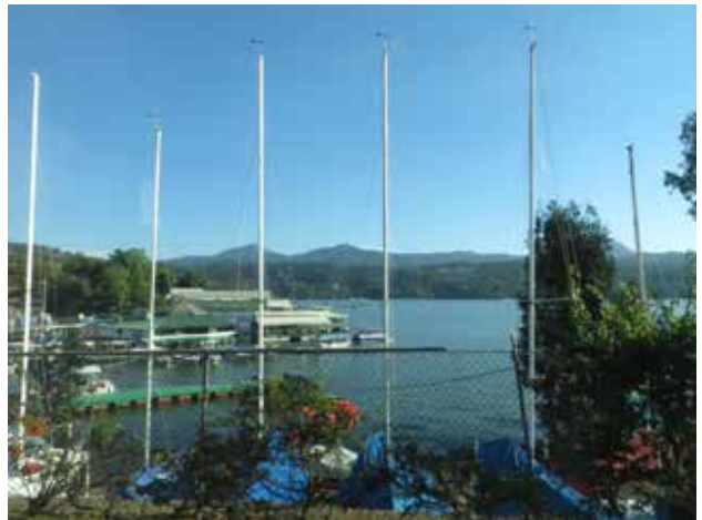
La marina du lac