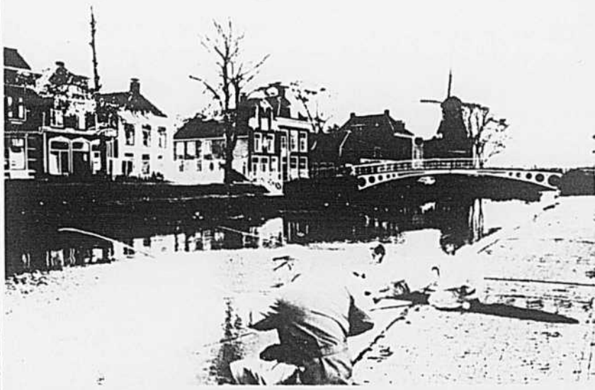
Au cours d'un «grand reportage» de la National Geographic Society présenté aujourd'hui à 21h30 sur les ondes du canal 10, nous rencontrerons les gens qui ont contribué à faire de la Hollande ce qu'elle est aujourd'hui. Nous constaterons l'importance que tient le commerce dans ce petit pays qui, déjà au XVe siècle, rivalisait avec l'Angleterre et l'Espagne. Nous visiterons ensuite Amsterdam, ville harmonieusement construite sur un important réseau de canaux et grand centre touristique.