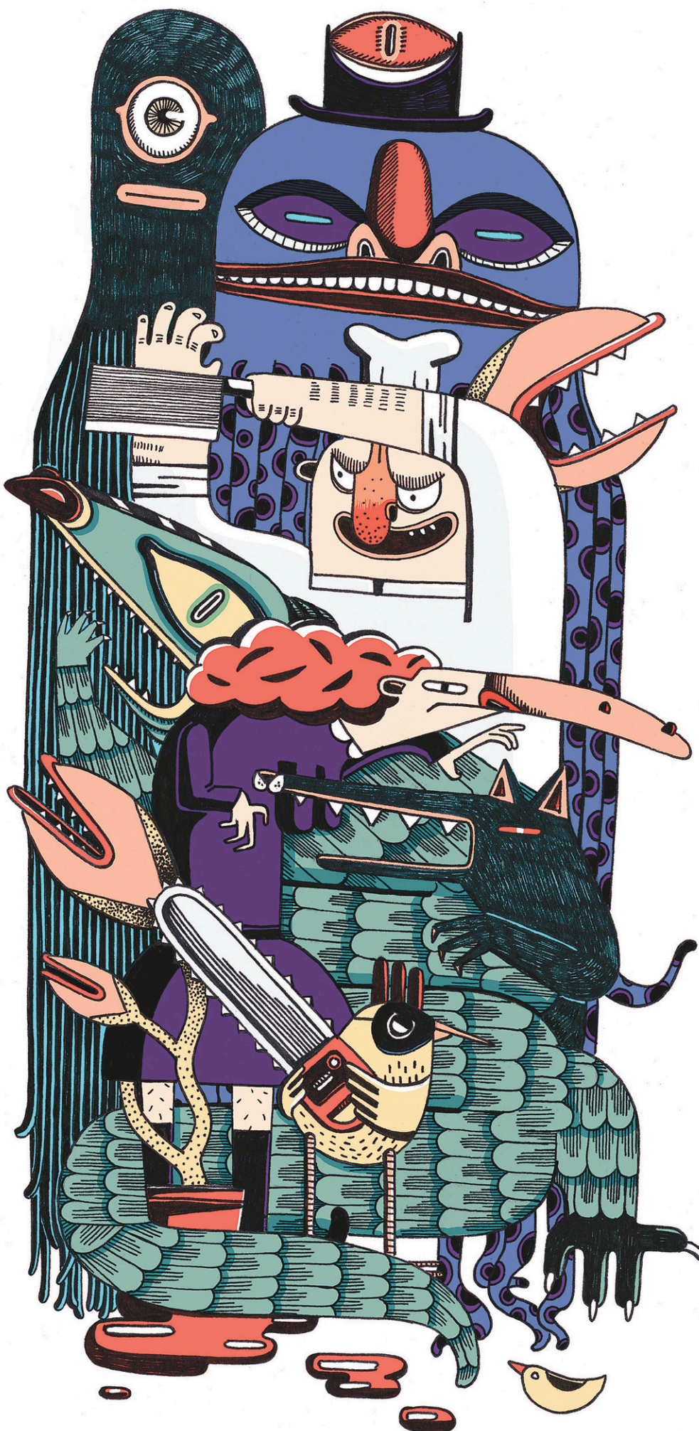
ILLUSTRATION MARION ARBONA

Avis légaux..... C 4 Décès..... C 7 Météo..... C 2 Mots croisés..... A 6 Petites annonces..... C 7 Sudoku..... A 6