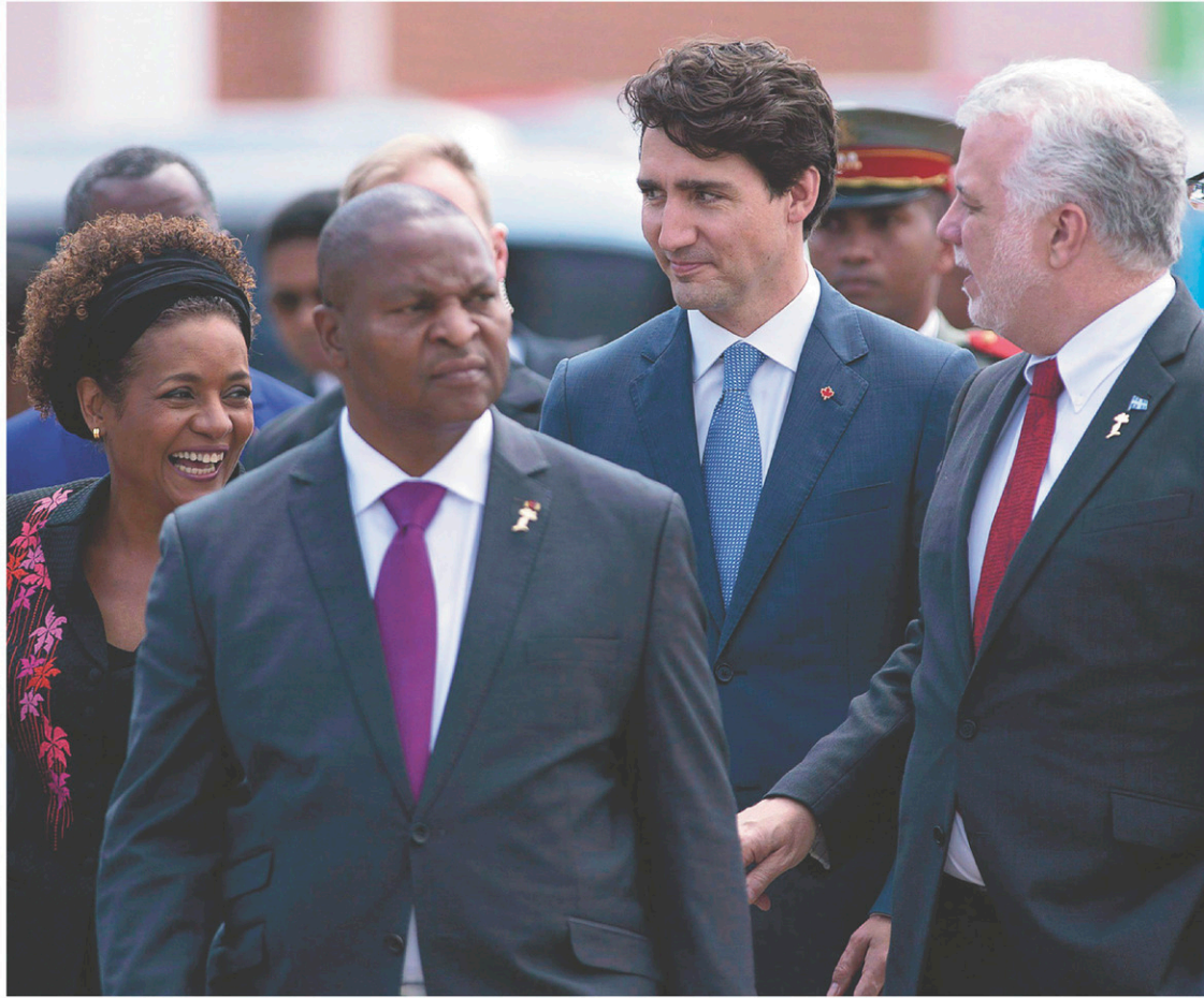
La secrétaire générale de l'OIF, Michaëlle Jean, le premier ministre du Canada, Justin Trudeau, et le premier ministre québécois, Philippe Couillard, lors du Sommet de Madagascar, en novembre.

L'ancien fonctionnaire déplore de plus qu'on n'ait pas saisi cette occasion pour mobiliser davantage les pays de l'océan Indien. « On peut s'éton-