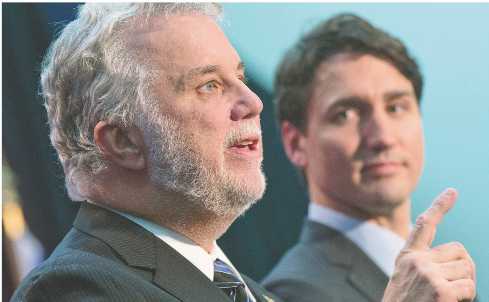
Les premiers ministres Justin Trudeau et Philippe Couillard se sont présentés ensemble vendredi matin à Outremont, à deux pas du futur complexe des sciences de l'Université de Montréal, pour annoncer l'accord des fonds conjugués.