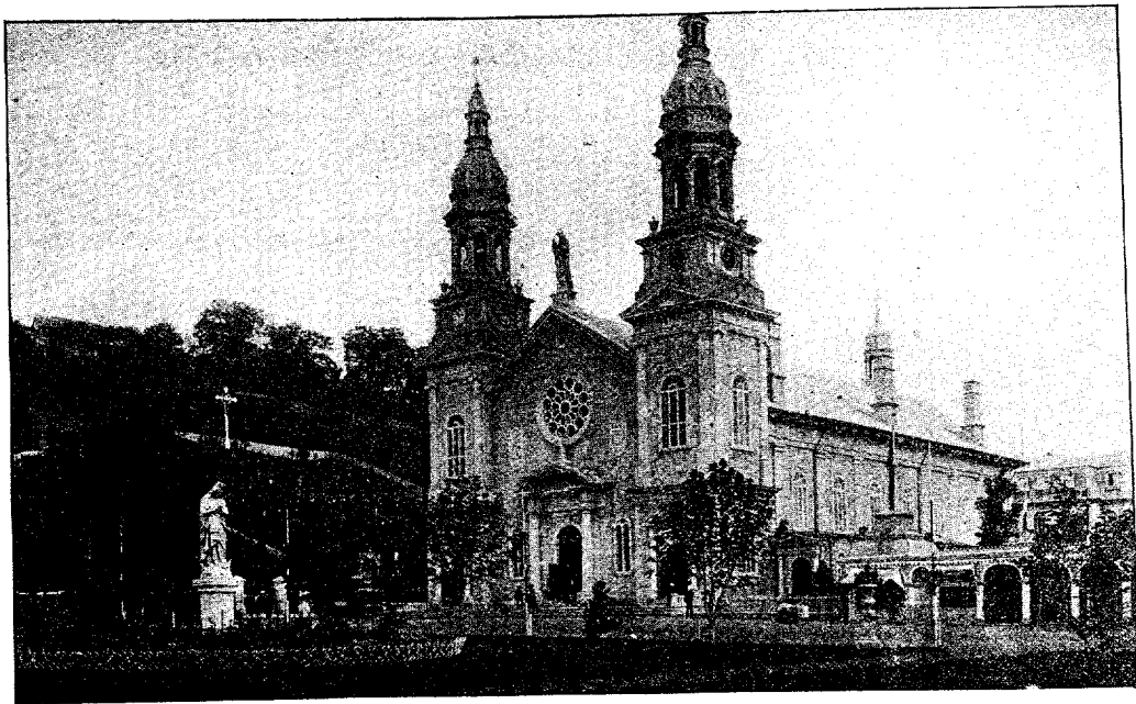
L'EXTÉRIEUR DE LA BASILIQUE DE STE-ANNE DE BEUPRÉ.