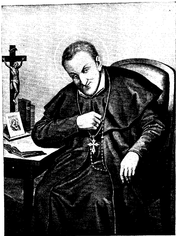
SAINTE ALPHONSE-MARIE DE LIGUORI, EVÊQUE, DOCTEUR DE L'ÉGLISE ET FONDATEUR DE LA CONGRÉGATION DU TRÈS SAINT RÉDEMPTEUR.