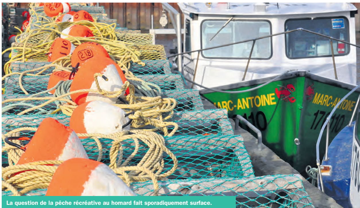
La question de la pêche récréative au homard fait sporadiquement surface.