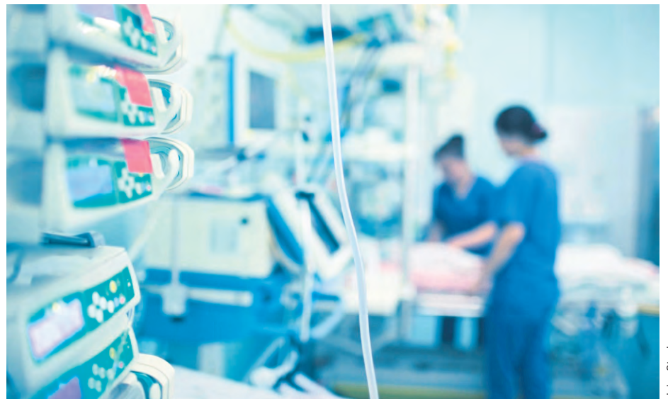
Certains secteurs restent en demande élevée, notamment les soins de santé et l'assistance sociale.