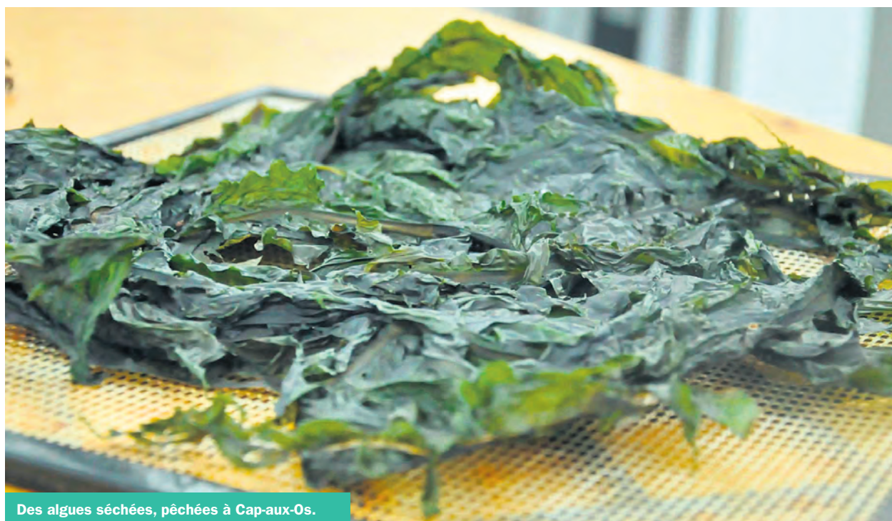
Des algues séchées, pêchées à Cap-aux-Os.

Interrogée sur la question du homard en particulier, la députée et ministre avait catégoriquement refusé en mai d'ouvrir la porte à une pêche récréative sur la Côte-Nord, indiquant qu'elle « encouragerait plutôt tout le monde à se procurer du homard chez leur poissonnier », selon des propos rapportés par Radio-Canada.