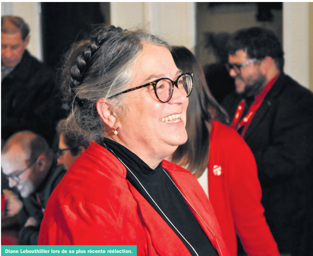
Diane Lebouthillier lors de sa plus récente réélection.

Elle précise qu'en contrepartie, sept pêches en un an ont été commercialisées (comme le concombre de mer) ou encore sont en expansion au sein de son ministère. «Ç'a été une énorme année. On a pratiquement déplacé des montagnes!»