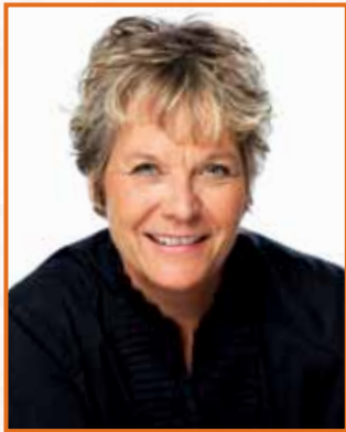
Chantal Rouleau Mairesse de l'arrondissement