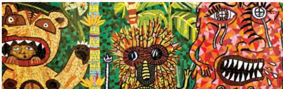
LE GRAND RASSEMBLEMENT UNE ŒUVRE DE ALLISON MOORE ET ARTHUR DESMARCEAUX

Dans le cadre de l'initiative L'art public dans les arrondissements de Montréal , une œuvre d'art public est intégrée à la section jeunesse de la bibliothèque de Pointe-aux-Trembles depuis juin 2011. L'arrondissement de Rivière-des-Prairies-Pointe-aux-Trembles et le Bureau d'art public de la Ville de Montréal ont organisé un concours à l'intention d'artistes professionnels en arts visuels afin de sélectionner l'œuvre qui s'harmoniserait le mieux avec le lieu choisi. À la suite de ce concours, un jury a choisi l'œuvre des artistes Arthur Desmarceaux et Allison Moore: Le grand rassemblement . Il s'agit d'une mosaïque très colorée qui représente un paysage mystérieux et exotique où se côtoient plusieurs créatures issues de l'imaginaire et de la culture populaire.