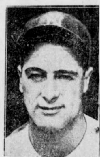
Lou GEHRIG, de l'équipe des Yankees, qui a frappé le premier coup de circuit des séries mondiales du baseball organisé hier après-midi à la quatrième manche contre les Cubs de Chicago, faisant entrer son copain Babe Ruth en avant de lui.

YANKEES Gehrig au bâton: Gehrig frappe une balle en bonds à Herman qui le met hors-jeu à Grimm; Lazzeri au bâton: strike, ball; Lazzeri frappe un terre-à-terre à Grimes; Grimes au bâton: Dickey frappe dans les mains de Cuyler; Pas de points, pas de coups sûrs, pas d'erreurs, personne sur les buts.