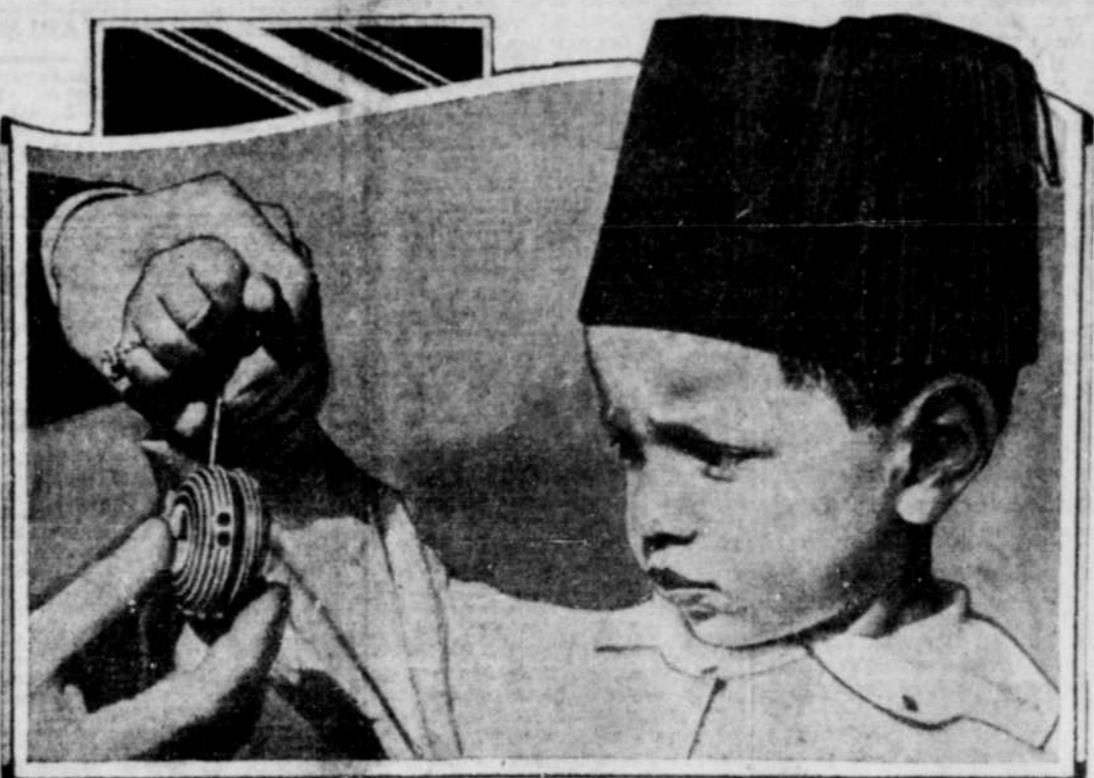
Comme les autres enfants, MOULAY EL HASSAN, fils du sultan du Maroc, a été fasciné, durant son séjour dans la Ville-Lumière, par ce jouet populaire qu'on dénomme le yo-yo. On le voit ici s'intéressant vivement à son joujou.

LES ENFANTS DES GRANDS S'AMUSENT COMME LES AUTRES