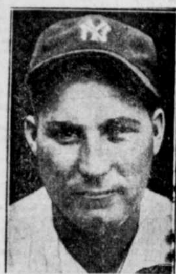
Charlie RUFFING, lanceur des Yankees, l'un des héros de la partie d'ouverture des séries mondiales hier après-midi.

YANKEES Hartnett au bâton: ball, strike, ball, ball; Combs prend son but sur balles; C'est le premier Yankee à atteindre le premier but; Sewell au bâton: Combs court au deuxième sac sur le terre-à-terre de Sewell; Grimm qui jongle avec la balle et met le frappeur hors-jeu au premier but; Ruth au bâton: ball, ball; Combs score sur un coup simple de Ruth dans le champ droit; la balle passe entre les jambes de Grimm comme un boulet; Gehrig au bâton: ball, strike, ball, strike sur une "curve", foul strike sur le grillage en arrière du marbre; Gehrig frappe un "home-