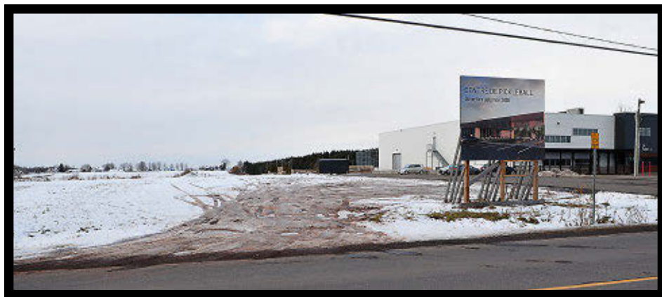
Le centre de pickleball sera situé sur le terrain vacant voisin de DekHockey Lotbinière.

Bien que d'autres annonces sont à venir pour préciser certains aspects, les copropriétaires indiquent déjà que le centre contiendra huit terrains de format «championnat», un bar avec nourriture, une section lounge et des vestiaires avec douches. Une boutique spécialisée en produits pour le pickleball sera