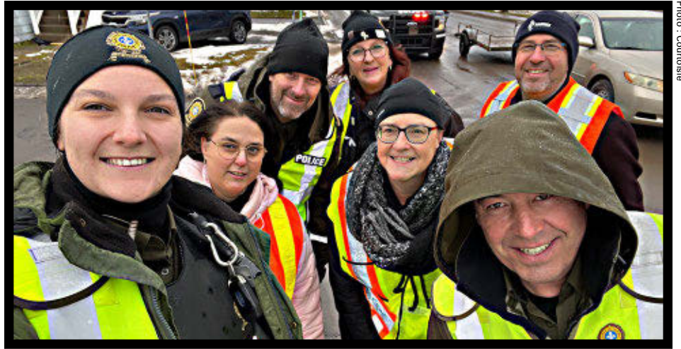
Un barrage routier a été tenu à Laurier-Station.

Le Centre-Femmes de Lotbinière souligne, encore cette année, les 12 jours d'action contre les violences faites aux femmes qui ont lieu du 25 novembre au 6 décembre. Plusieurs actions ont été posées pendant cette période pour sensibiliser la population à cette réalité.