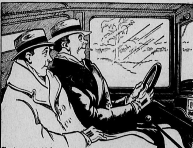
Tas-pas déjà dit à un compagnon de route, que tu ne comprenais pas un homme qui osait sortir en auto sans chaînes en hiver—