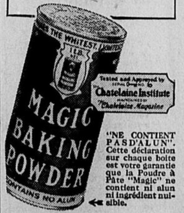
Fabriquée au Canada

Tamisez dans un bol farine, poudre à pâte et sel. Incorporez le beurre. Ajoutez le lait froid et faites une pâte molle. Roulez sur une planche enfarinée et découpez en carrés. Piquez des pommes et enlevez-en les coeurs. Remplissez l'espace du cœur avec un peu de beurre, de sucre et de cannelle. Placez une de ces pommes sur chaque carré de pâte, puis repliez celle-ci de façon à ce qu'il n'y ait pas d'ouverture nulle part. La vapeur à l'intérieur du chausson devant cuire la pomme pendant que la chaleur extérieure cuit la pâte. Badigeonnez les chaussons d'un peu de crème, placez-les dans une léchefrite graissée et faites cuire à four modéré (400° F.) pendant 40 minutes. Servez avec crème ou sauce dure.