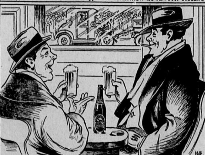
Tas-pas déjà essayé la BLACK HORSE dans un moment de dépression?

dites simplement— "Bière Black Horse Dawes s.v.p.!"