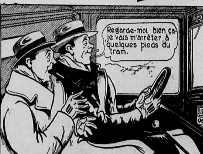
Et pour lui faire voir comme tu es bien ta voiture sous contrôle, tu l'approches d'un tramway, dans l'intention de l'arrêter soudain.