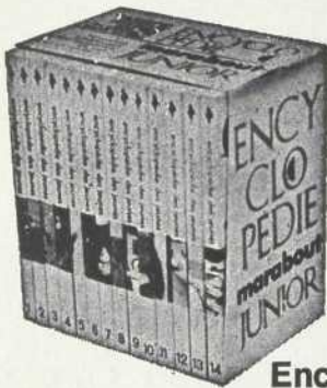
Encyclopédie des jeunes (14 volumes)

pour toute la famille ...et pour les amis