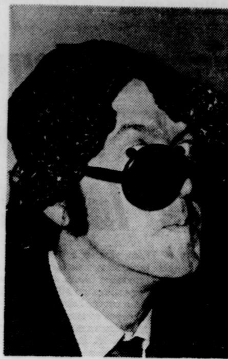
par Jean-Paul ARSENAULT

Question: "Votre tête pousse-t-elle à travers vos cheveux, en d'autres mots, ceux-ci tombent-ils comme les feuilles d'automne? La cellulite remplit-elle le miroir de votre chambre à coucher? Plus encore, votre mari se couche-t-il tôt tous les soirs... mais pour lire seulement? Oh! que voilà de gros problèmes pauvre petite madame."