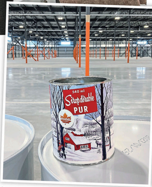
Le nouvel entrepôt dispose d'une capacité d'entreposage de 52 millions de livres de sirop d'érable.

Pour inaugurer le bâtiment et lancer la saison des sucres comme il se doit, des joueuses de La Force de Montréal étaient présentes pour une partie de hockey balle inaugurale. En effet, comme l'érable est une source d'énergie naturelle qui contient des vitamines