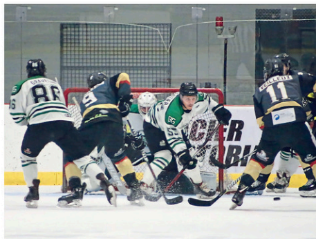
Métal Pless

« Plein de malchances et d'épreuves sont arrivées durant cette saison, avec des blessures, des joueurs qui ne se présentaient pas aux matchs et la COVID-19. On avait eu en tout 44 joueurs