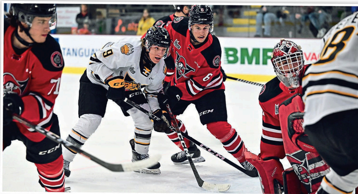
Les Tigres, qui peinent à trouver le fond du filet, traversent une période difficile. Ils ont notamment essuyé un revers de 3 à 1 contre les Voltigeurs de Drummondville, dimanche, au Colisée Desjardins.

matchs si on se prend en main. Notre dernier voyage là-bas n'a pas été facile émotionnellement et j'espère que les gars se rappellent de la défaite de 7 à 0 contre Val-d'Or. Cette fois-ci, j'ai confiance que ce sera très différent », commente-t-il.