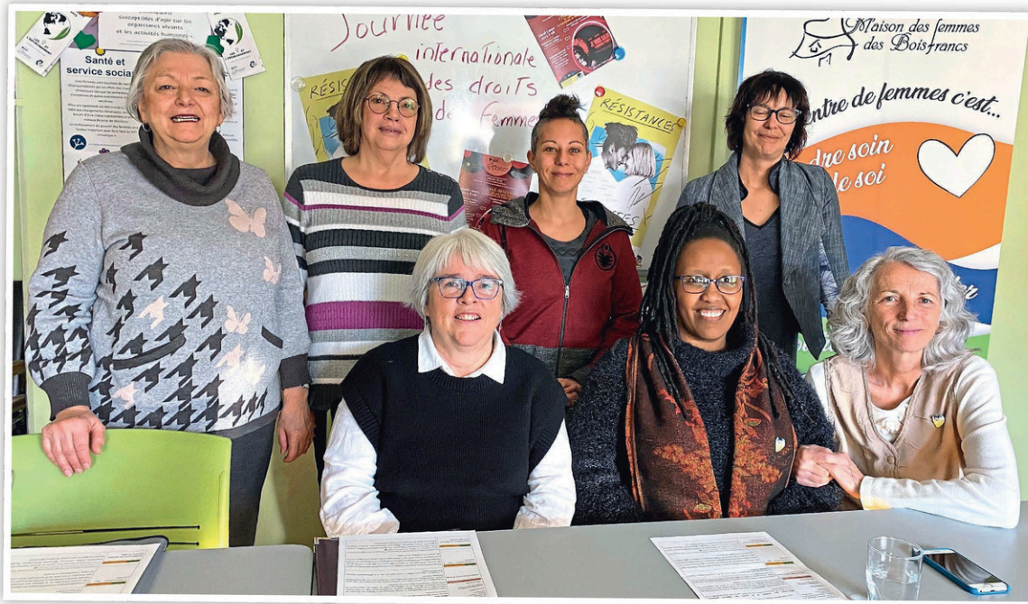
Des représentantes de la Maison des femmes, du comité féministe et de Femmes action de l'Érable

L'activité se veut un moment pour célébrer le 8 mars, réfléchir sur les violences numériques, se rallier, appeler à des changements de société et, bien sûr, échanger avec la coréalisatrice.