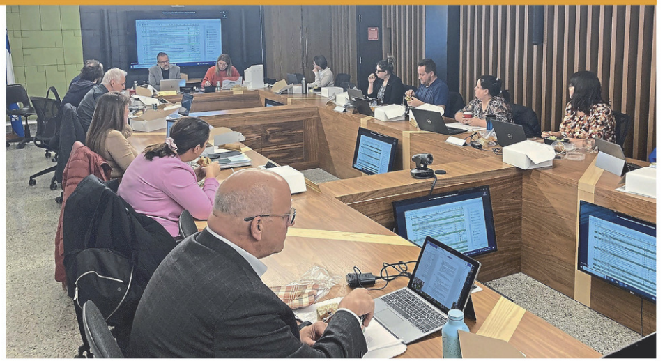
Le conseil d'administration réuni pour sa séance de février.

Les cinq écoles nationales en sont donc à préparer un dossier qu'elles présenteront au ministère pour créer ces bourses qui seraient dédiées aux élèves choisissant d'étudier dans l'un des établissements. Parlant de bourses, 32 bourses Parcours doivent s'ajouter l'an prochain au Cégep.