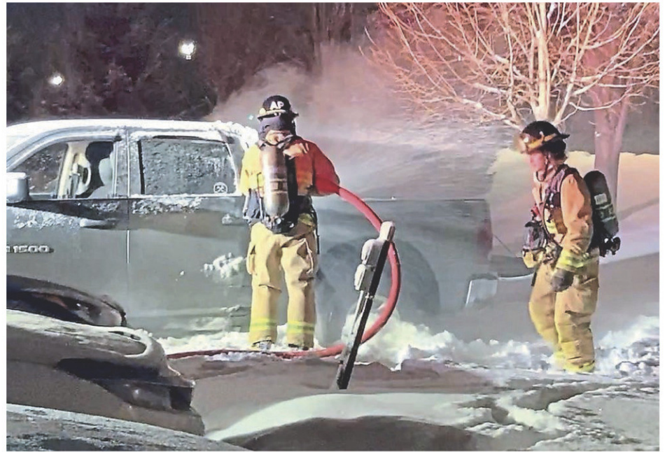
Le feu est survenu lors d'une manœuvre de stationnement.

Les pompiers de la Régie Incentraide ont répondu, samedi matin, à un appel pour un feu de cheminée sur le 6 e rang Ouest à Saint-Rosaire.