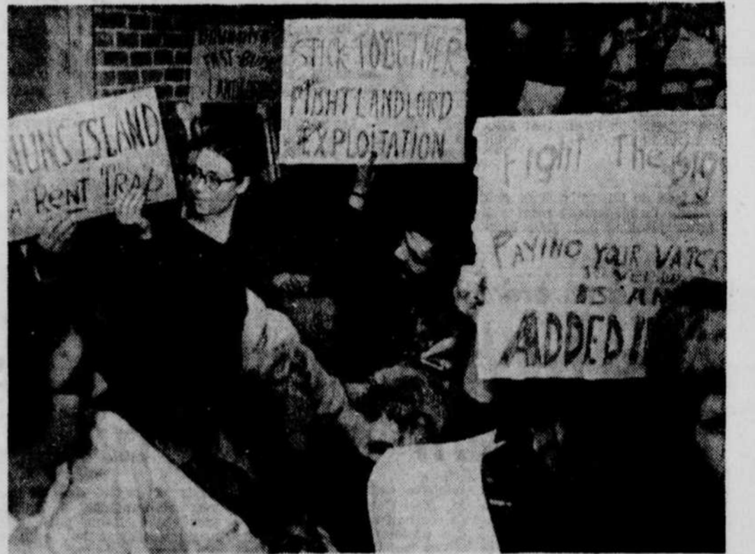
Les résidents de l'île des Soeurs protestent contre la hausse exagérée des loyers. Le ministre Jérôme Choquette les avait assurés de son assistance. Mais selon la loi, 500 locataires ont dû hier avorter leur propriétaire qu'ils désiraient le renouvellement de leur bail.

Demandez le patron no:—7187 comprenant le patron pour le beret dans les grandeurs: petit, médium ou grand et en plus le patron pour l'écharpe et le manchon.