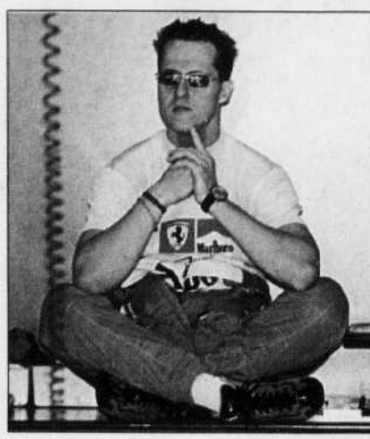
L'Allemand Michael Schumacher, qui n'a signé que le cinquième temps sur sa Ferrari hier, semblait songeur.

«Nous avons fait du bon boulot en vue de la course, a-t-il analysé. Je dois cependant me concentrer davantage sur la qualification. Je n'étais vraiment pas performant avec les pneus neufs.»