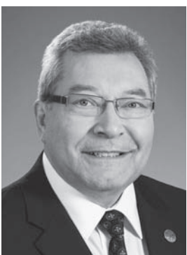
Monsieur Guy Hardy Député de Saint-François Président de séance Membre du Bureau de l'Assemblée nationale

*L'offre est en vigueur pour une durée limitée et peut être modifiée sans préavis. Les taxes sont en sus. Le Sublime est à 39,99 $ par mois pour les six (6) premiers mois, puis à 60,00 $ par mois après la période de promotion de six (6) mois. Le nombre de chaînes varie d'un marché à l'autre. Le crédit sera appliqué à votre compte au moment de l'activation de votre matériel et de votre service. Les taxes sont en sus. L'offre s'adresse aux clients admissibles qui n'ont pas été abonnés à Shaw Direct au cours des 180 derniers jours. L'installation est sans frais pour les deux premiers récepteurs. Des frais d'installation variant de 49,99 $ à 99,99 $ s'appliquent pour les unités supplémentaires. Maximum de six (6) récepteurs par compte. Des frais pour récepteurs multiples de 5,99 $ par mois peuvent s'appliquer aux clients qui ont deux récepteurs ou plus. Des frais d'envoi peuvent s'appliquer. Limite d'un coupon de la TALC ou de la VSD par client, par mois. Le coupon est valable aussi longtemps que le compte du client est à jour et ne peut être transféré à un autre compte ou à une autre adresse. Le coupon est d'une valeur de 7,99 $ ou moins et ne peut être appliqué à un événement ou à un film pour adultes. Tous les services de Shaw Direct sont assujettis à nos Conditions de service et à notre Politique de confidentialité.