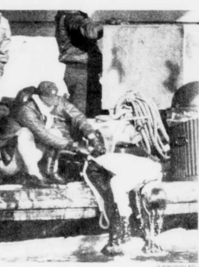
Le corps du co-pilote du Boeing d'Air Florida est retiré des eaux glacées du Potomac, à Washington. Plusieurs corps restent encore au fond du fleuve.

En 1932, il se rend à Moscou, officiellement pour étudier dans une université spécialisée. En fait, il profite de ce séjour pour rencontrer le chef des services de renseignement de l'armée soviétique.