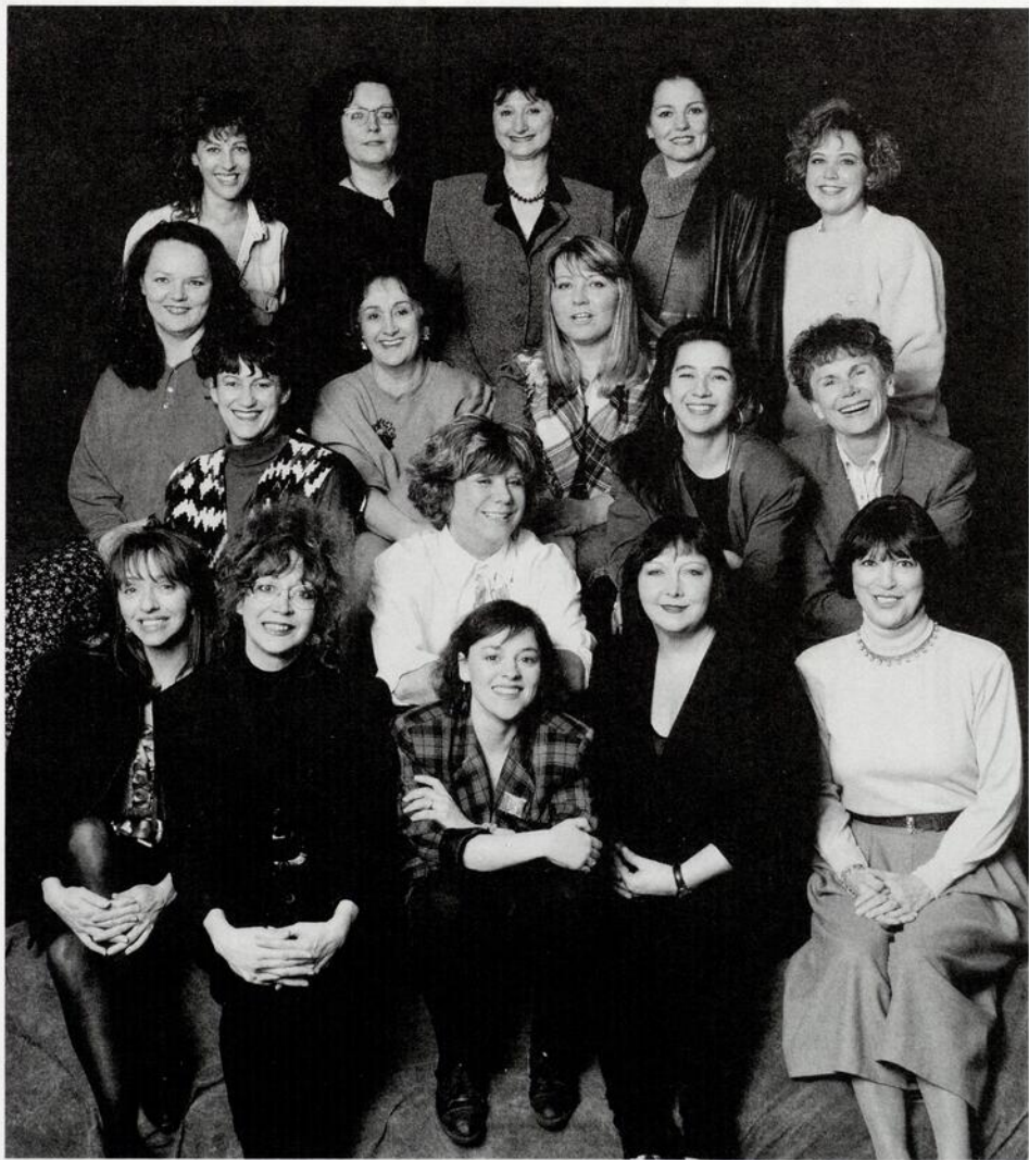
L'équipe des Belles-Sœurs