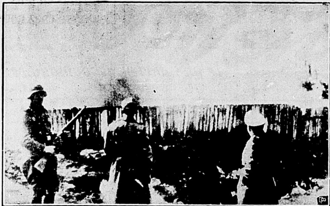
Les Nazis sont passés par là! Ces soldats allemands regardent brûler les cadavres de civils polonais massacrés, que l'on a entassés et enduits de gasoline. Le seul crime commis par ces Polonais fut d'avoir voulu, comme nous, être libres et maîtres chez eux. Seule la résistance britannique empêcha les Nazis de venir ici. Pour assurer la victoire finale, il faut envoyer des combattants outre-mer, sur cette première ligne de défense. La dernière campagne de recrutement a dépassé son objectif mais la Patrie aura encore besoin d'hommes pour prêter main-forte aux 250.000 Canadiens qui sont déjà en service actif. Allons au-devant de l'ennemi, n'attendons pas qu'il vienne ici!

de Léon Daudet. Les jugements portés sur les hommes, s'ils ne prétendent pas à une sereine objectivité, paraissent se rapprocher souvent de la vérité. Ce livre nous inroduit dans les coulisses de la politique française et démasque les profiteurs qui ont conduit la IIIe République à l'abaissement et à la défaite.