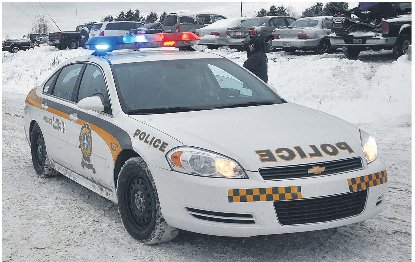
L'homme a été transporté à l'hôpital de Gaspé, inconscient pendant le trajet. Il a plus tard été transféré vers Québec par avion-ambulance.

L'homme a été transporté à l'hôpital de Gaspé, inconscient pendant le trajet. Il a plus tard été transféré vers Québec par avion-ambulance. Au moment de mettre sous presse, il était dans un état critique, mais stable. L'alcool et la vitesse pourraient avoir joué un rôle dans l'accident, mais rien n'a été confirmé par la SQ. L'homme, originaire de la région de Gaspé, aurait subi un traumatisme crânien. Plus de détails sur notre site web.