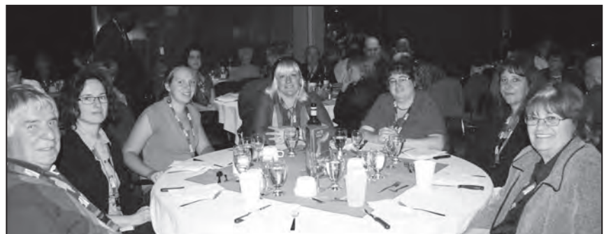
Le 11 octobre, l'arrondissement du Mont-Bellevue fêtait une centaine de ses bénévoles au Musée des sciences et de la nature. Ici, une tablée de bénévoles du Jardin communautaire Marcel-Talbot et de Famille Plus.