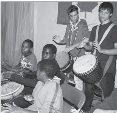
La salle a vibré au son des jembe des élèves de Jeunes Musiciens du Monde.