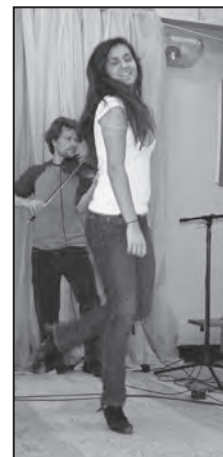
Une gigue offerte par une élève de JMM.