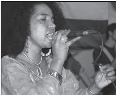
La chanteuse Solange, parée de ses plus beaux atours africains.

des bénévoles de l'événement, que ce soit dans la logistique, la décoration, la préparation des repas ou le service aux tables. C'est ce qui en assure le succès!