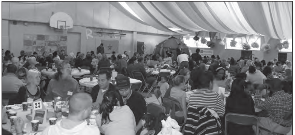
L'ambiance était à la bonne humeur et à la découverte de « l'autre »...

La formule du brunch interculturel, qui veut que gens issus de l'immigration et gens de souche partagent un repas à la même table, est sans contredit un merveilleux prétexte