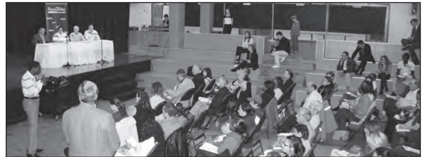
Le 22 septembre, c'est à l'école internationale du Phare que la Ville de Sherbrooke faisait, avec divers intervenants du milieu, son Bilan et perspectives en matière d'intégration des immigrants : un exercice très constructif et prometteur pour les actions futures.

Ne jetez pas ce numéro de Regards : recyclez son papier!