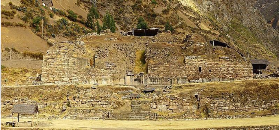
Chapitre 12 : un des temples en ruine de la civilisation de Chavin