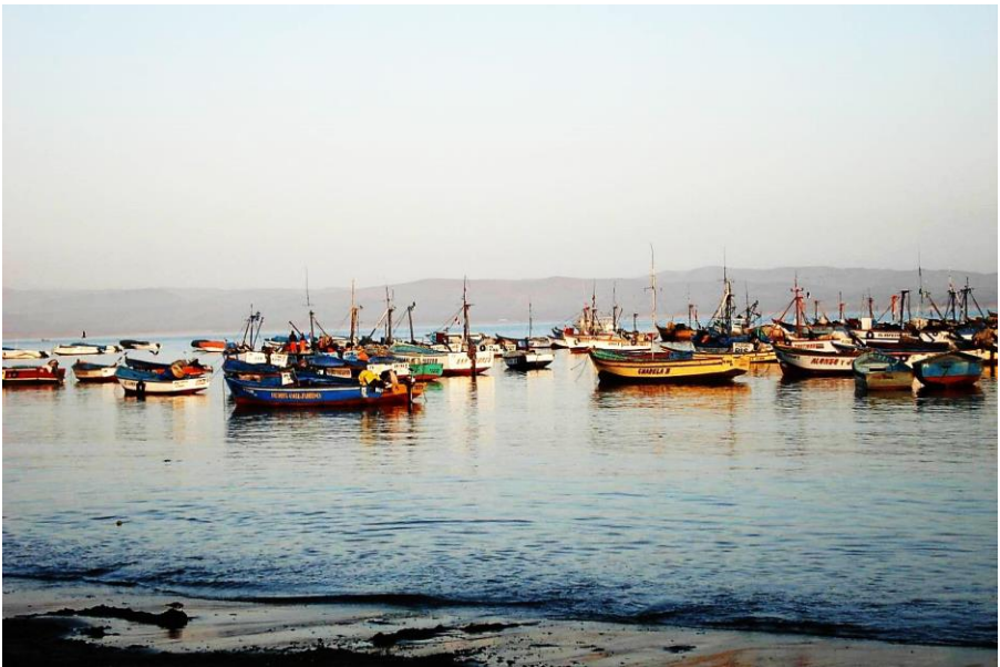
Chapitre 20 : port de Paracas, au soleil couchant