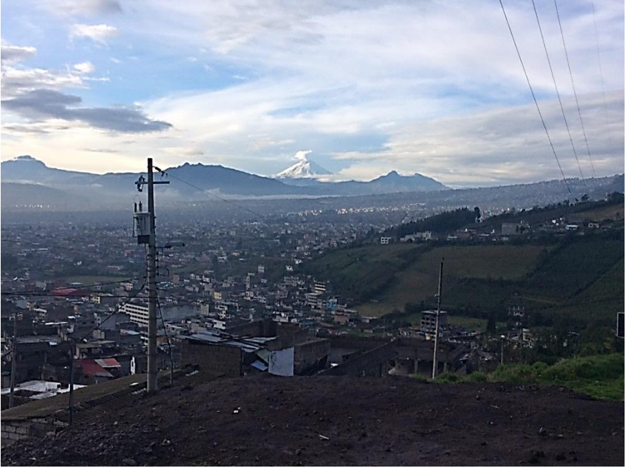
Chapitre 35 : Vue de Quito sud, au pied du volcan Cotopaxi