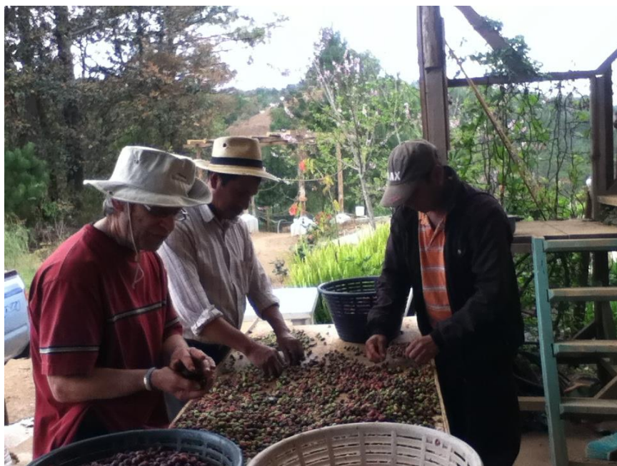
Chapitre 56 : triage des grains de café (oro vs pergamino)