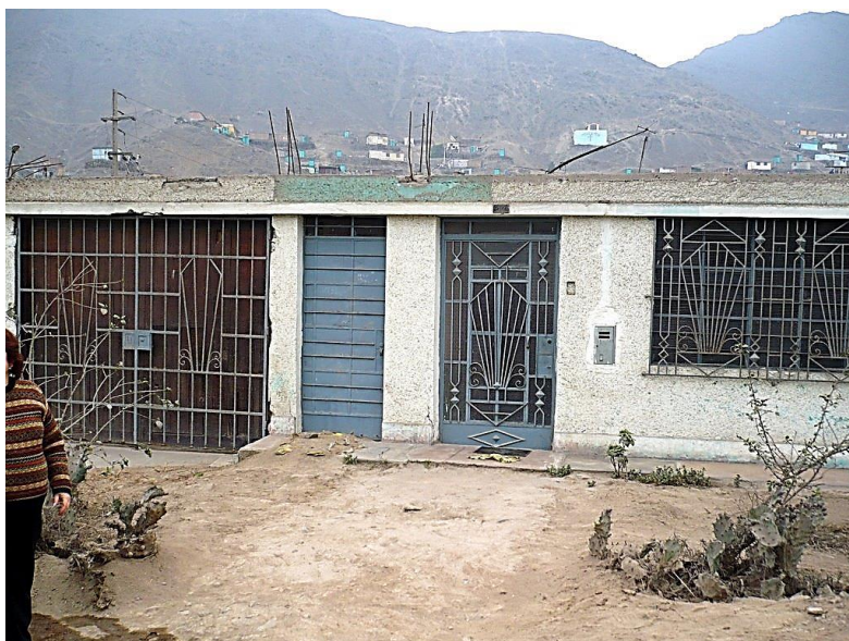
Chapitre 2 : La casa de acogida para las mujeres maltradas, quelques mois avant notre arrivée.