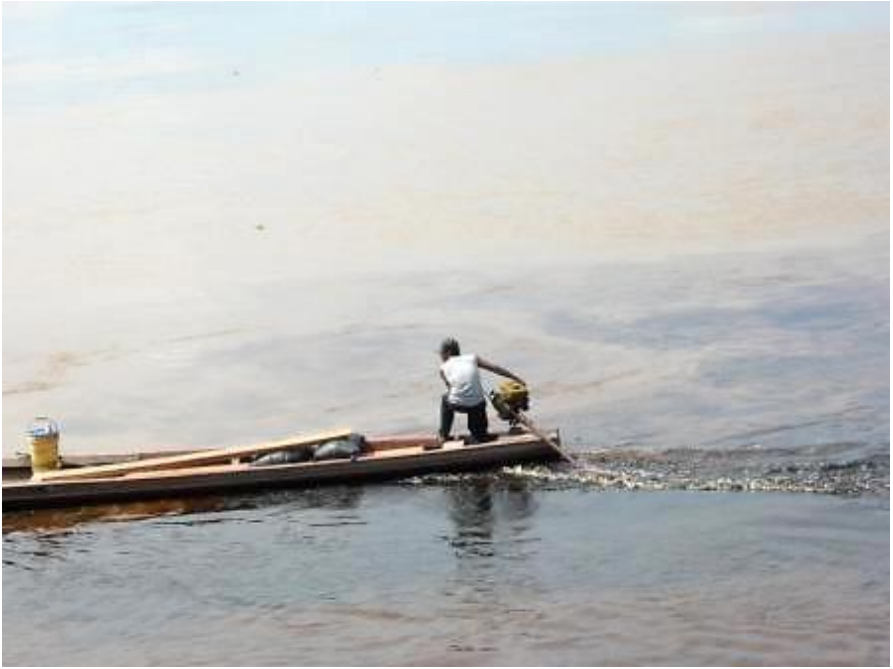
Chapitre 26 : peque-peque remontant une rivière de la jungle.