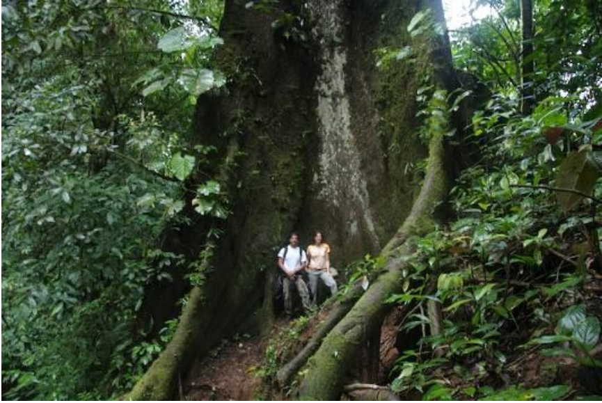
Chapitre 27 : ceiba ou lúpuma (kapokier) entouré de la végétation typique de la selva