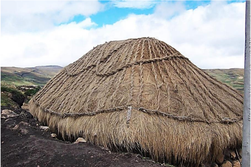
Chapitre 13 : hutte en ochka dans les hauts pâturages des Andes