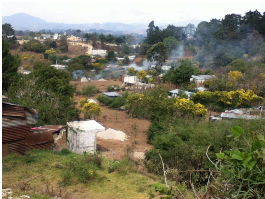
Chapitre 55 : champs de maïs dénudés après la récolte et pendant le brûlage des tiges sèches.