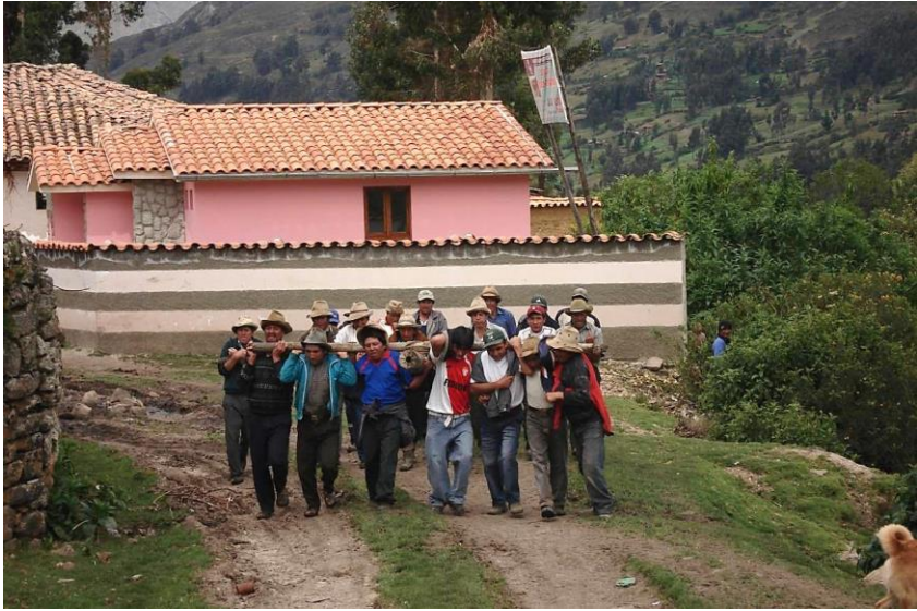
Chapitre 18 : faena de transport d'un poteau d'électricité en ciment