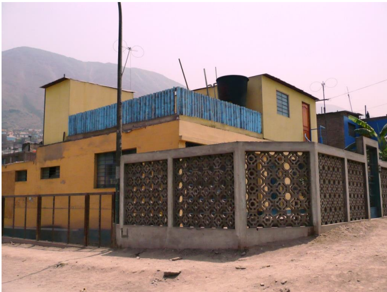
Chapitre 15 : la Casa de acogida lors de notre départ, en 2008