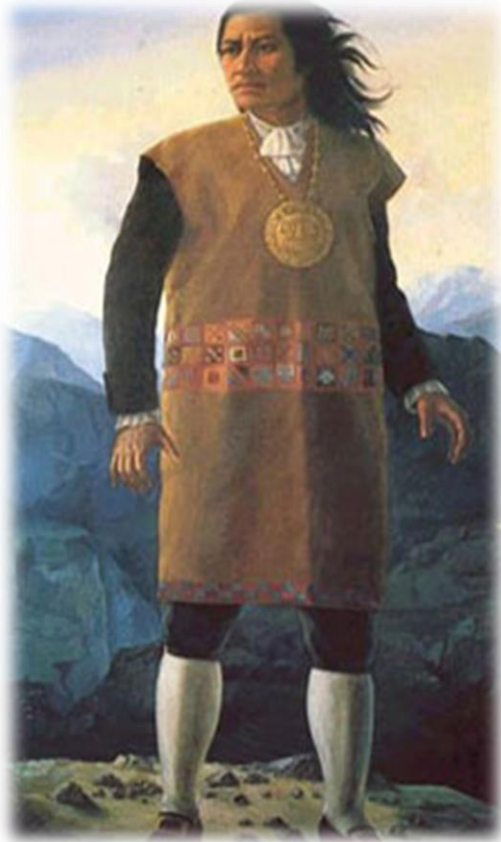
Chapitre 1 : Tupac Amaru II (1738-1781), descendant du dernier empereur Inca du Pérou. Héros de la première révolte américaine des Indigènes contre les envahisseurs espagnols en 1780.