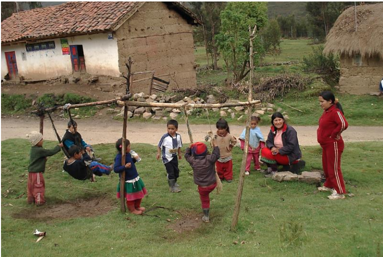
Chapitre 19 : enfants jouant dans la cour de l'école de Rufina, à Huamparan