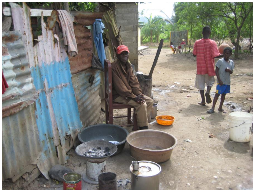
Chapitre 38 : la vie quotidienne dans le batey