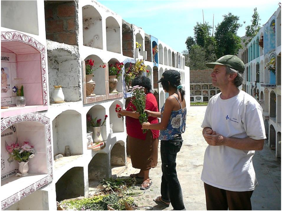
Chapitre 25 : hommage aux morts dans le cimetière de Santa Cruz de Flores