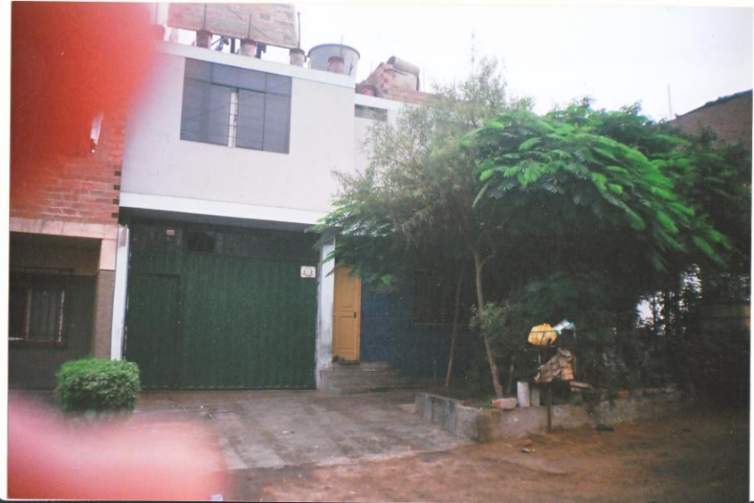
Chapitre 5 : Maison de Celestina à Collique. En haut sur le toit, le royaume des perros!

J'ai vu pire, honnêtement. Au Québec, des enfants de 8 ans, perdre leurs vacances à garder les vaches dans les champs. Pour économiser des rouleaux de broche et des poteaux de clôture.