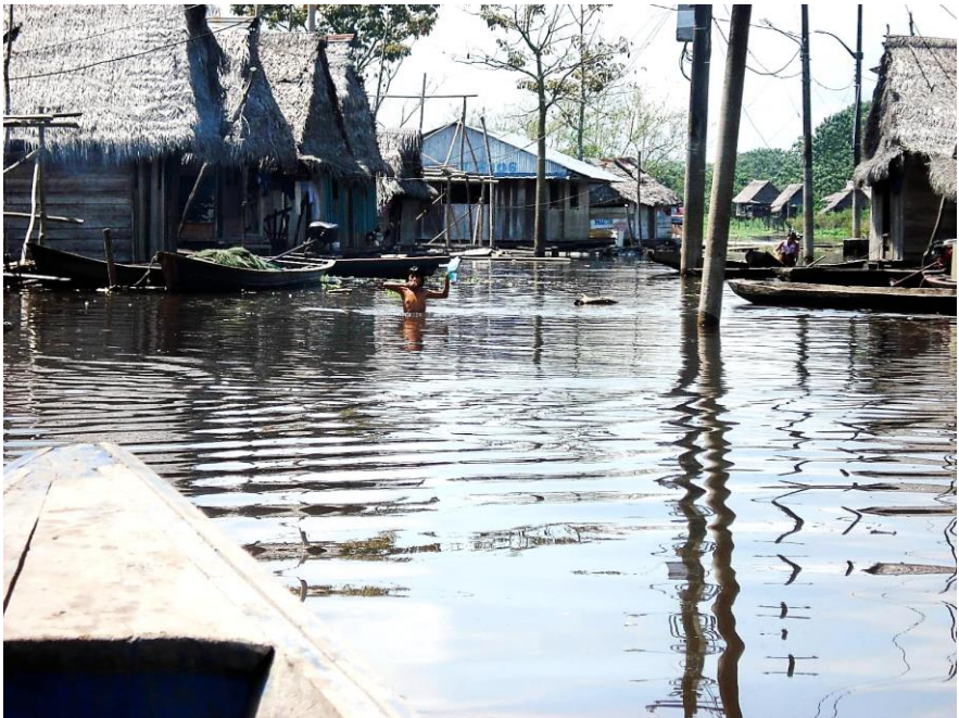
Chapitre 30 : rue de Belén, la Venise des pauvres à Iquitos

Non, elle ne partagerait pas le sort des dizaines de millions de sud-américains qui viennent à la grande ville pour s'y enterrer vivants, désespérés de ne pouvoir revenir aux pueblitos d'où ils sont partis. Elle naviguerait à contre-courant, peu importe la difficulté. Elle avait son secreto pour venir à tout de tout, sa potion magique de siete raices . Si elle avait pu les aider à sortir de Yarinha, elle les aiderait aussi à s'y replonger. Et pourquoi pas?