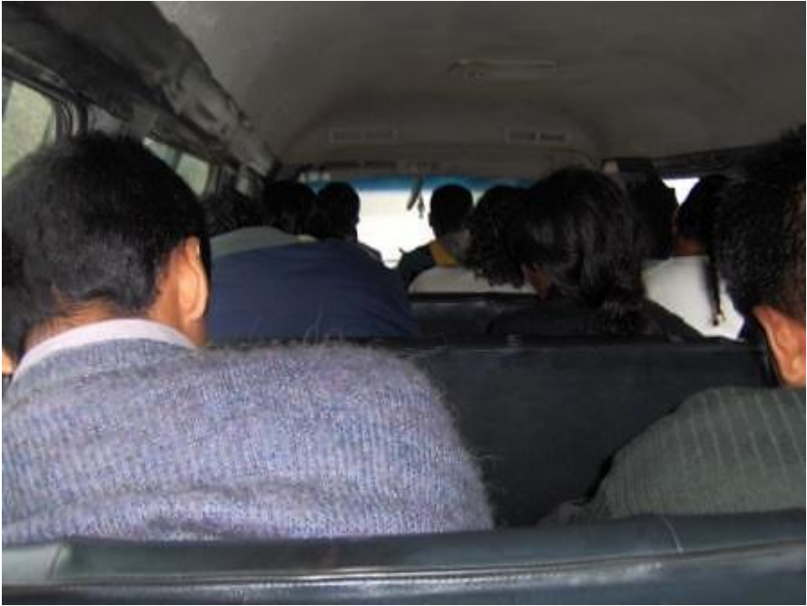
Chapitre 9 : à l'intérieur d'un combi