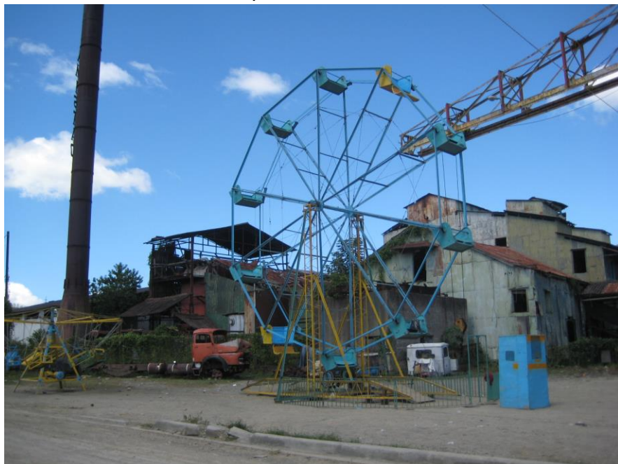
Chapitre 36 : squelette rouillé de l'ingenio de La Amistad, recyclé en décor de fête foraine.

Mais, nature humaine aidant, il y a toujours une solution à l'horizon. Il s'agit de transformer un cuando hay en un cuando no hay . Une sorte de voile magique qui aveugle l'oeil policier pendant un bref instant. Le temps qu'il faut pour ouvrir la porte d'une cellule ou apposer un sceau d'approbation sur un formulaire. Un voile tissé de pesos entrelacés.