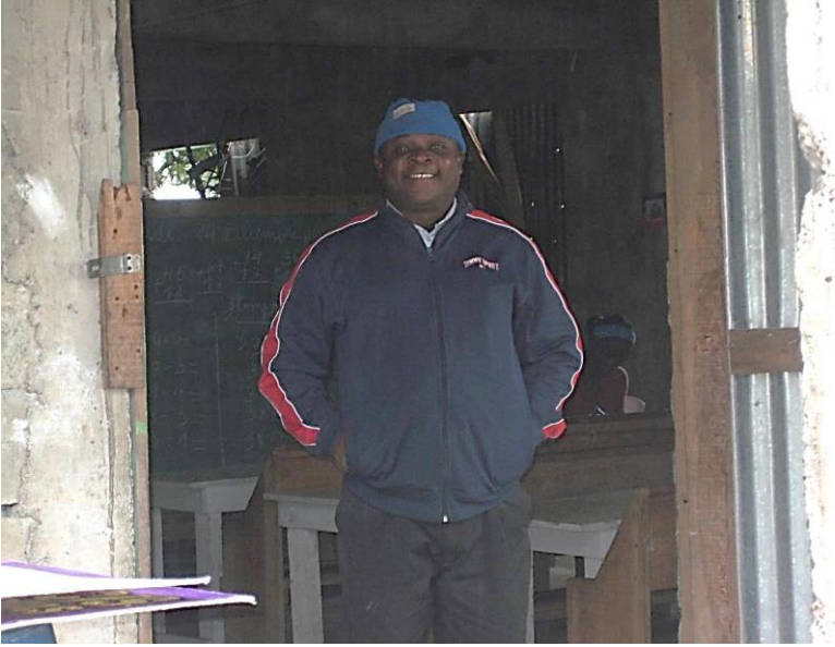
Chapitre 39 : Un des nombreux pastols haïtiens de batey devant son église-école