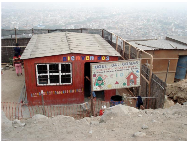
Chapitre 11 : la casita roja, près de l'endroit où arrive le camion d'eau

Tout le monde se dirige ensuite vers la wawawas 51 pour y écouter les comptines des enfants et boire à la joie bruyante de leurs jeux.