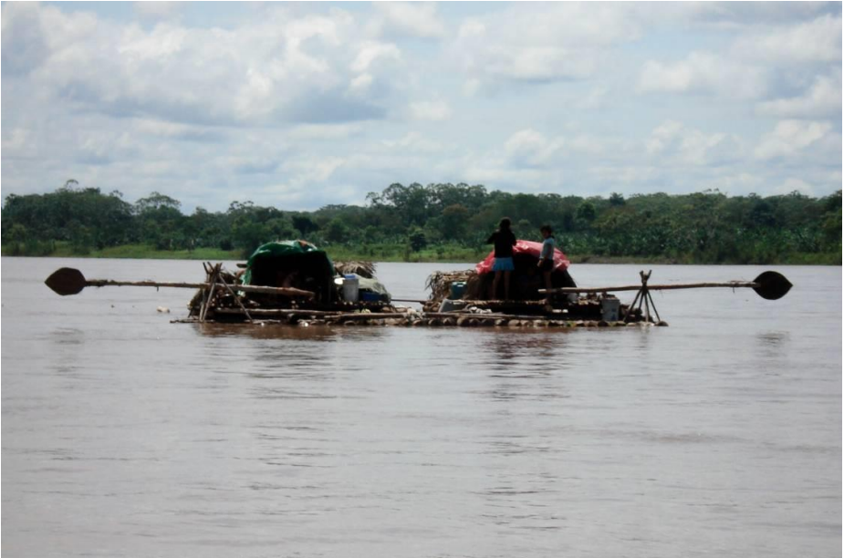
Chapitre 29 : balsa descendant le courant du Marañon avec sa cargaison de plátanos et de shuntas