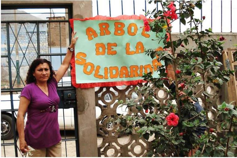
Chapitre 15 : arbre de la solidarité dans la cour de la Casa Rosa Lluncor, lors de notre retour en 2009