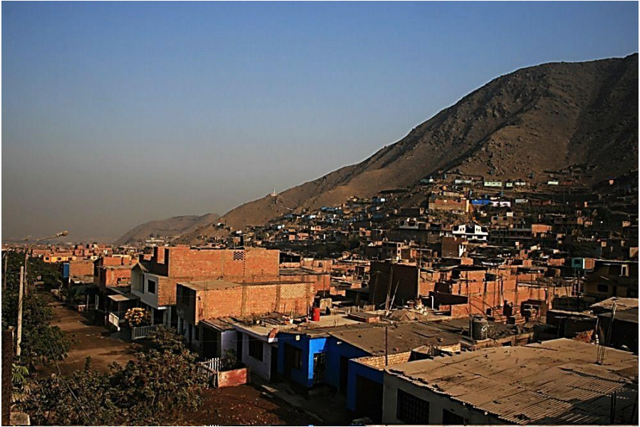
Chapitre 8 : les collines (cerros) de Collique. Les zones pauvres sont les plus hautes en altitude