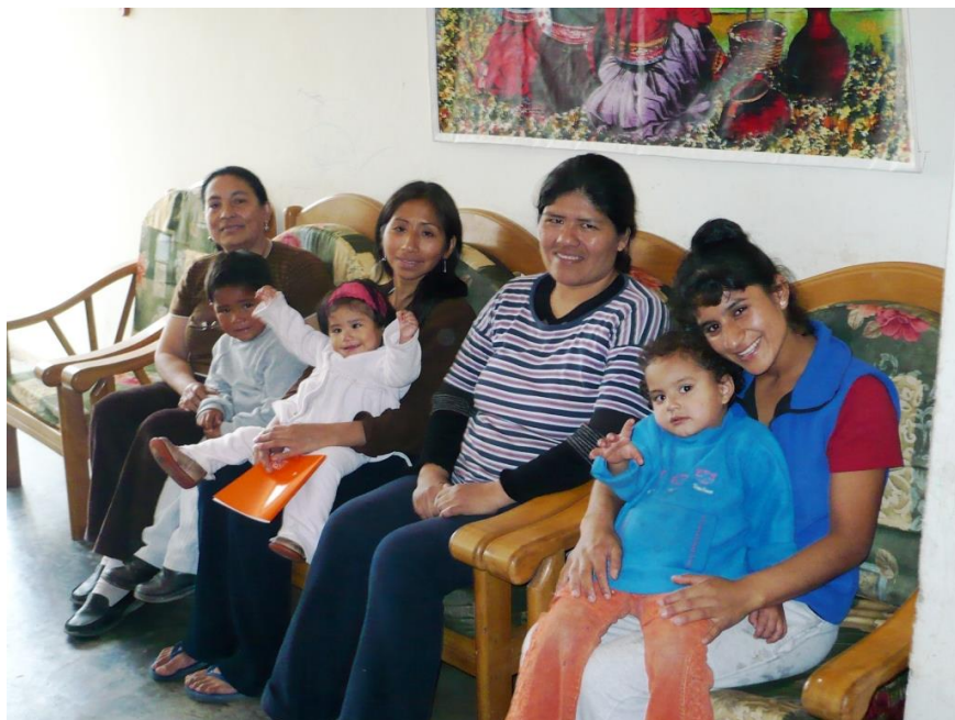
Chapitre 17 : femmes et enfants de la Casa de acogida. Au revoir !

viendra un jour les rejoindre. Elle ne le sait pas encore, mais elle récupérera même sa robe de mariée mochica, laissée au prêteur sur gage du Lambayaque.