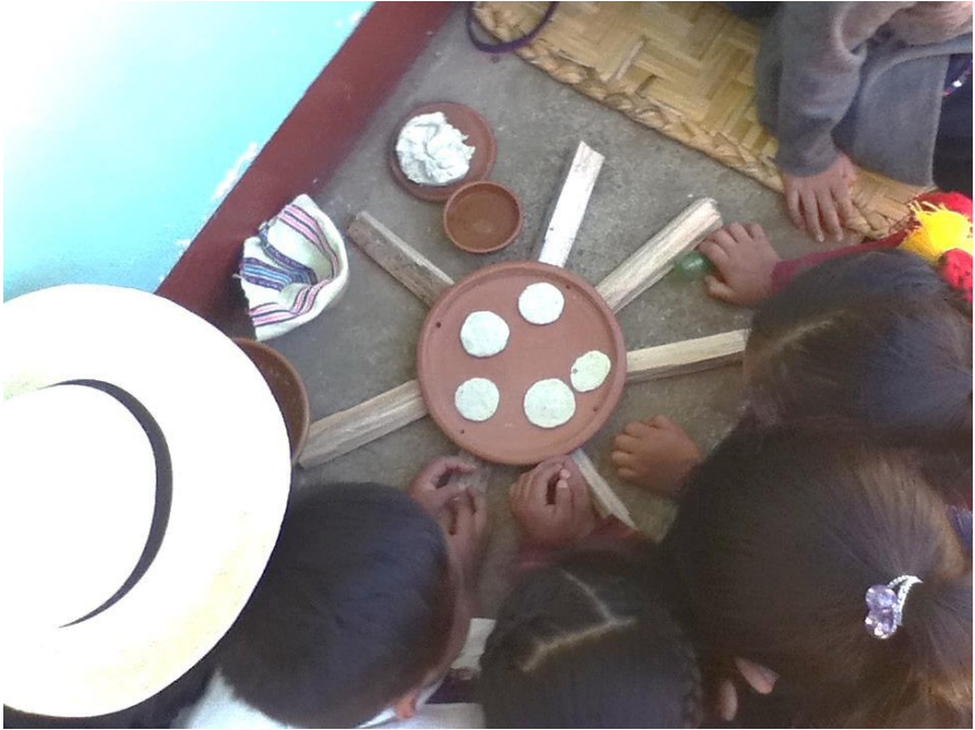
Chapitre 53: reproduction d'un comal rustique en terre cuite, avec ses tortillas cuisant en son centre.