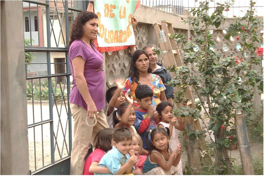
Chapitre 24 : femme, enfants et promotora de la Casa de acogida, en compagnie de l'auteur