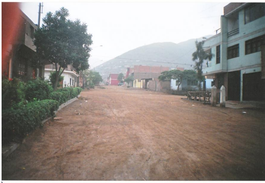
Chapitre 4 : Une rue typique de Collique, dans la tercera zona