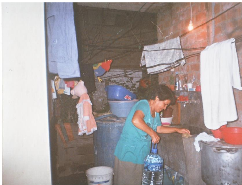
Chapitre 3 : Celestina, la petite Inca, dans son lavoir, avec ses nombreuses réserves d'eau

Et voilà. Je viens d'apprendre que l'eau est rare au pays de Inti, le soleil inca. Chaque jour, on vit à la merci du maître du robinet, qui ouvre et ferme à sa guise la valve de la vie, arrosant des îlots de Péruviens ci et là, comme un fermier irrigue ses champs: tant pour les tomates, mais un peu moins pour le maïs de la tercera zona de Collique. Tant pis pour moi si je vis dans un champ qui ne sera plus arrosé aujourd'hui!