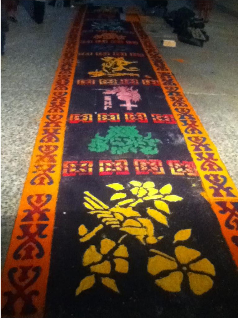
Chapitre 57 : tapis fait de bran de scie teint, épanché dans la rue, autour duquel passent les andas.