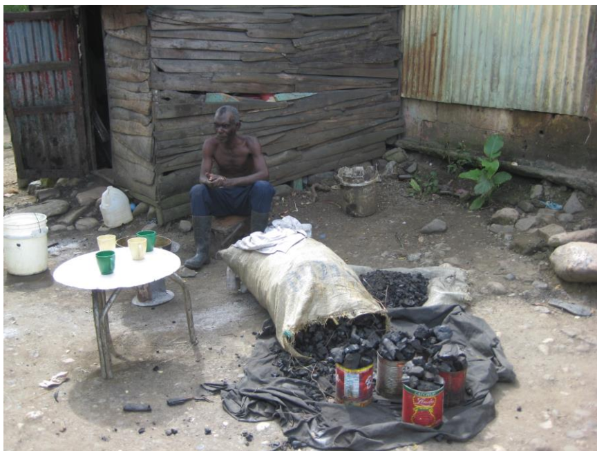
Chapitre 37 : El carbonero avec son étal devant lui.

Plus vieux que je ne l'aurais cru... Faudra sans doute songer à former bientôt une relève, même s'il n'est pas question pour lui de prendre une retraite, sauf pour se coucher sur son lit de mort. C'est déjà tout un exploit d'être parvenu à cet âge en ayant passé sa vie dans un batey . Il mériterait bien qu'on lui rende ses dernières années plus faciles et le poids de ses journées moins accablant.