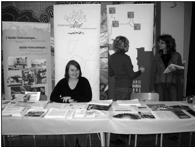
Journée pédagogique août 2009

Depuis plus de deux ans, le Conseil de la culture réalise différentes approches en milieu scolaire afin de mieux faire connaître le milieu culturel auprès des intervenants de l'éducation. Fort du succès du premier speed-dating culture/éducation tenu en août 2009, le CCAT a décidé de déposer ce projet d'activité lors de l'appel d'ateliers du colloque bisannuel des commissions scolaires de la région qui se tiendra en novembre prochain. Ainsi, nous voulons que cette activité soit présentée aux professeurs, directions d'école et conseillers pédagogiques de toute la région désirant vivre une rencontre directe avec le milieu culturel régional en vue de faciliter et d'encourager l'intégration des arts et de la culture dans l'éducation. Nous aimerions également profiter de cette occasion pour présenter aux participants un portrait général du milieu culturel régional et inviter le MCCCCF à venir expliquer le programme Culture-Éducation.