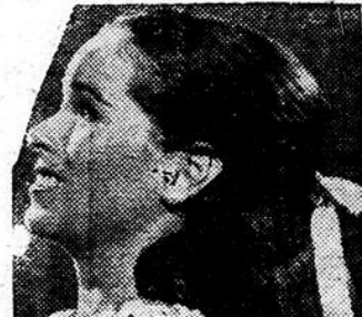
CHARLTON HESTON — GERALDINE CHAPLIN