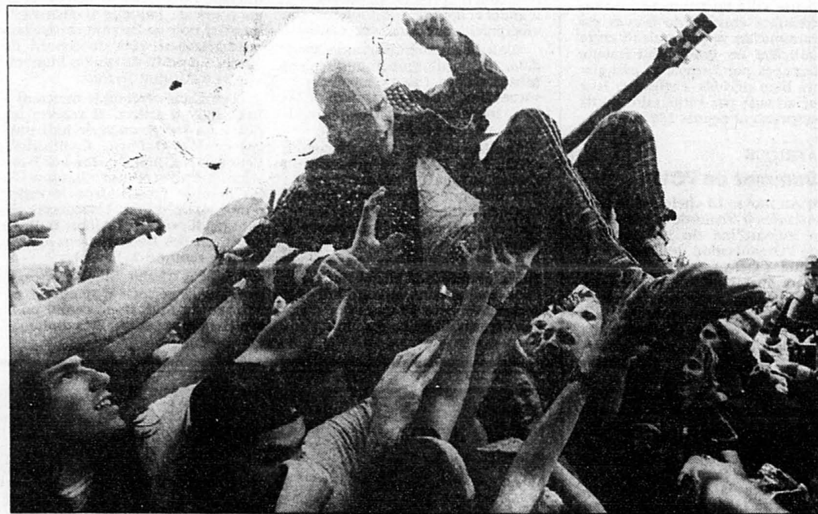
Le Lollapalooza, qui avait lieu hier au Parc de l'Exposition de Québec, a attiré 21 000 fans de rock, allant de la tendre adolescence à la mi-vingtaine. Les plus chanceux ont eu le privilège de faire valser le guitariste du groupe Rancid au-dessus de leurs têtes.

Ce travailleur en climatisation et cette étudiante en chimie-biologie