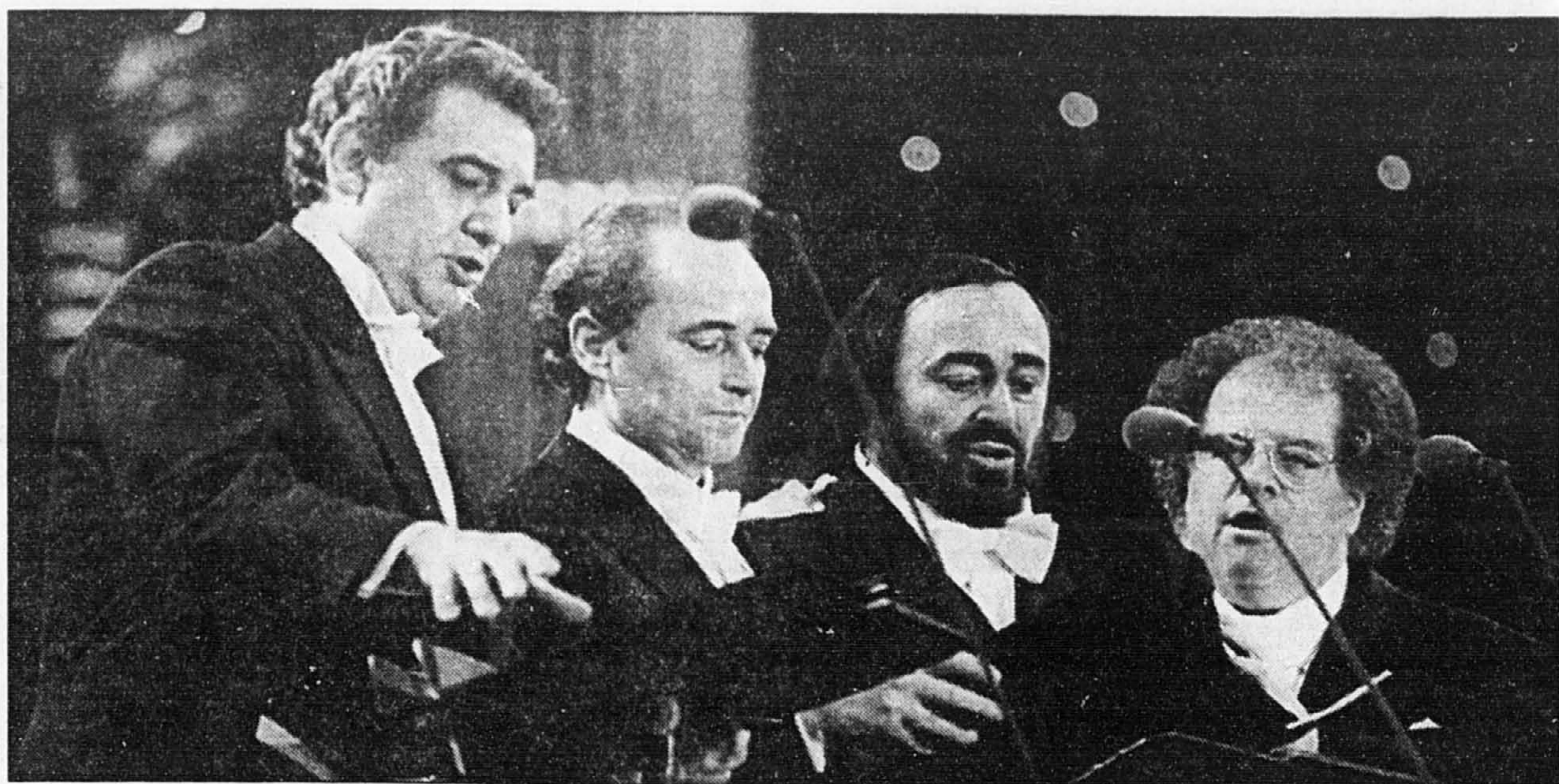
Placido Domingo, José Carreras et Luciano Pavarotti étaient accompagnés par le Philharmonia Orchestra de Londres, conduit par James Levine, du Met, à droite.