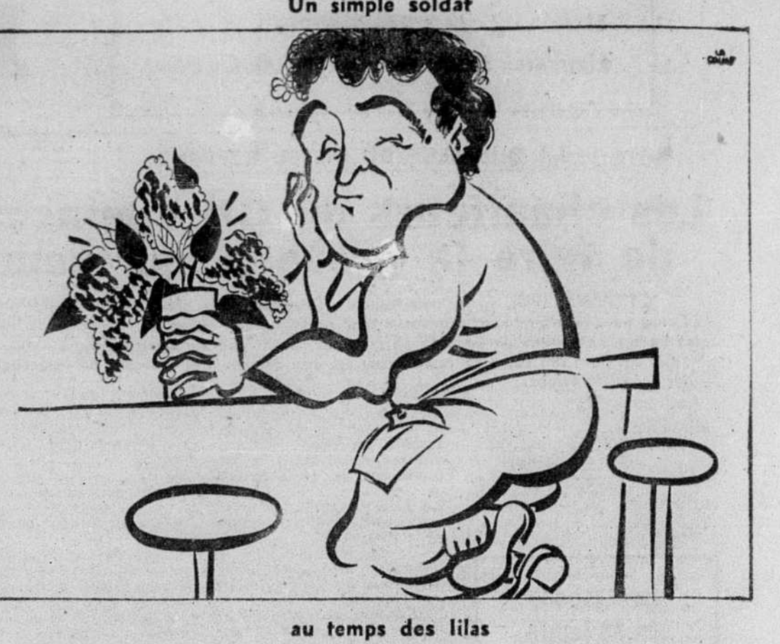
Un simple soldat

On a pu dire que la crise de Suez avait indirectement contribué aux massacres de Budapest; l'Occident ne doit pas risquer de répéter une pareille erreur. Sans compter qu'une intervention militaire au Proche-Orient peut déclencher une autre guerre de Corée, sinon même un conflit de plus grande envergure. Rien d'étonnant que devant ces multiples dangers, plusieurs pays neutres et plusieurs pays occidentaux, dont le Canada, aient exprimé à Washington et à Londres leurs inquiétudes devant la perspective d'une action militaire au Liban.