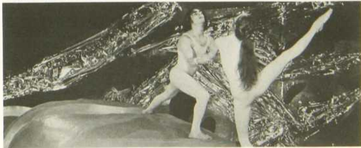
Canticum Canticorum Salomonis

Dans une réalisation de Jean-Yves Landry l'oeuvre de ce musicien unique sera illustrée par une partition récente composée entre 1970 et 1973, le Canticum Canticorum Salomonis . Conçue pour seize voix et un orchestre de chambre, l'oeuvre sera diri-