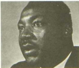
Martin Luther King

On évoquera donc cette vie exemplaire aux Beaux Dimanches du 28 septembre, de 20 h 30 à 21 heures, sur la chaîne française de Radio-Canada.