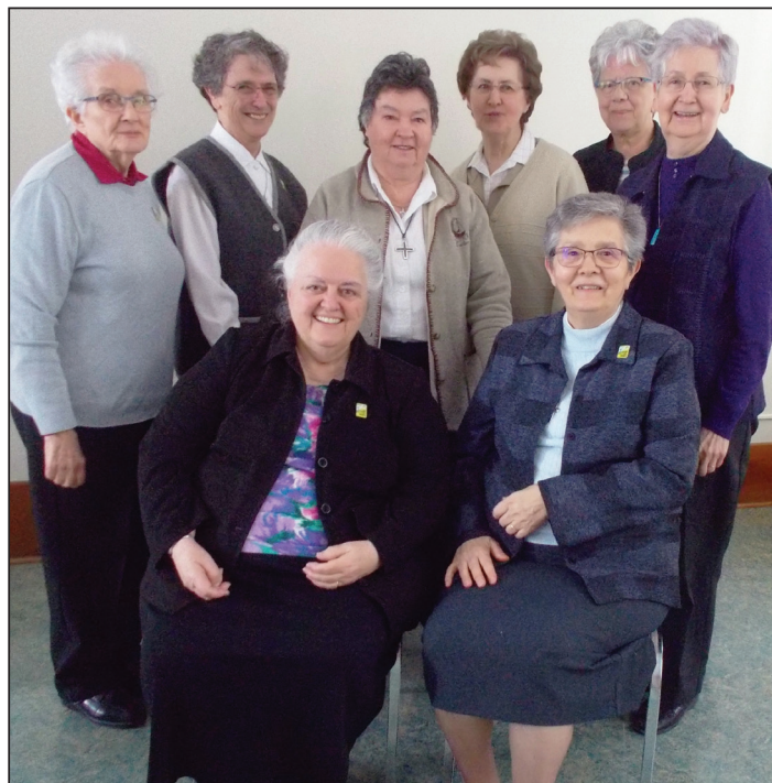
Québec, 11 mars

Enfin, comme lors de chaque réunion, il y a eu échange de bonnes nouvelles, d'articles de journaux, suggestion de volumes etc. Un repas a prolongé la joie de la rencontre.