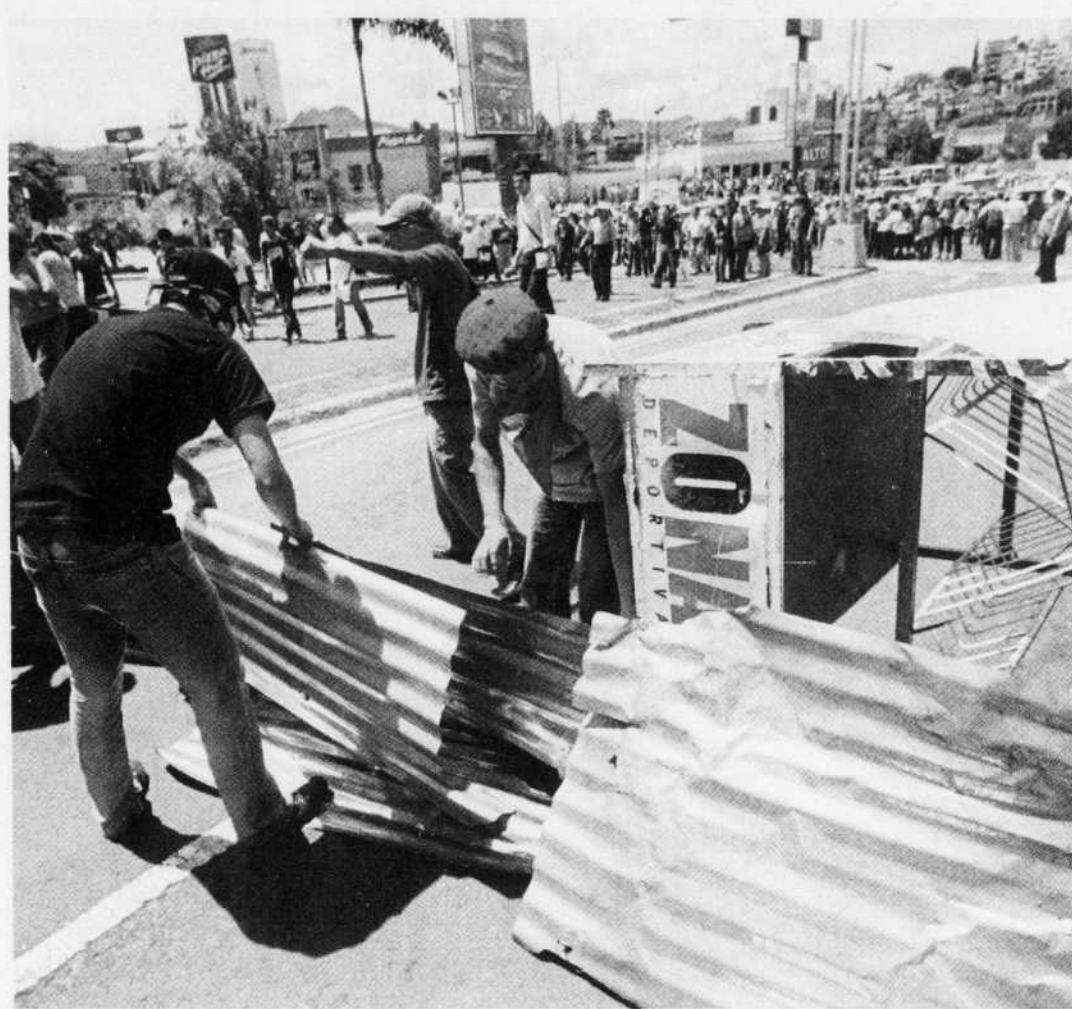
Des partisans du président Zelaya ont installé hier des barricades près du palais présidentiel.

L'Espagne, la France et l'Italie ont déjà annoncé le retrait de leur représentant, à l'instar des pays d'Amérique centrale et des gouvernements de gauche de la région, comme le Venezuela, Cuba, l'Équateur, la