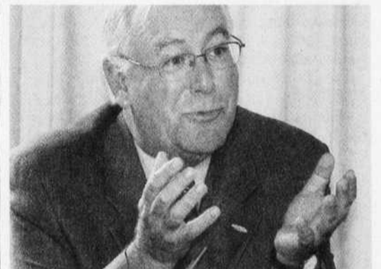
BUREAU DU COMMISSAIRE AU LOBBYISME DU QUÉBEC André C. Côté quittera demain son poste de commissaire au lobbyisme du Québec.