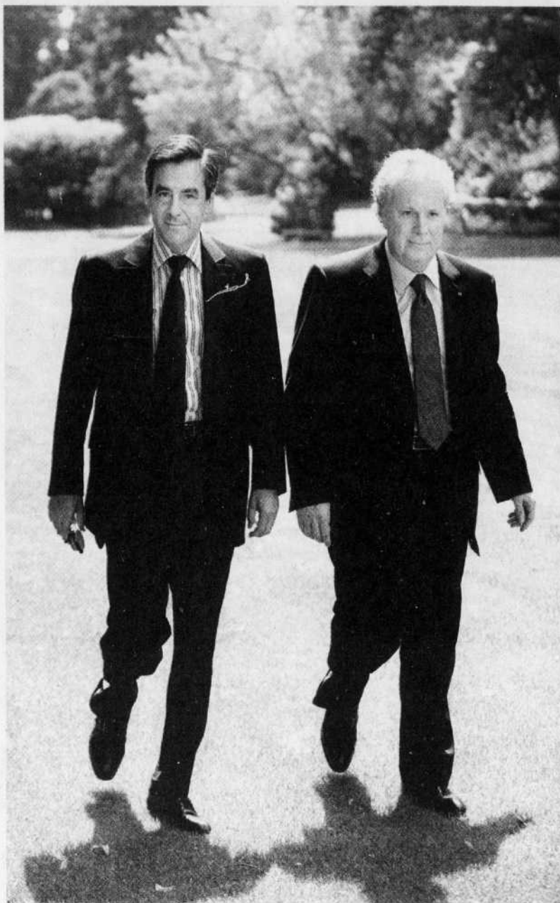
Le premier ministre français, François Fillon, et son homologue québécois, Jean Charest, dans les jardins de Matignon, hier.

Pas plus tard que la semaine dernière, le mémorandum français soumis à la réunion des ministres de