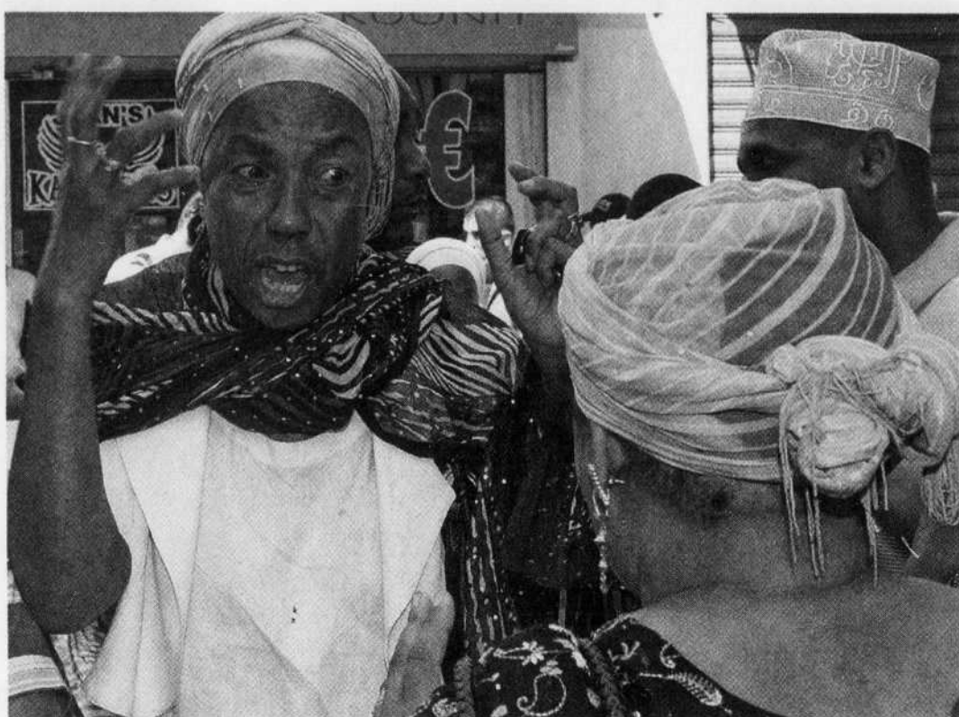
À Marseille, des manifestants ont forcé la fermeture d'agences de voyage.

La catastrophe soulève tragiquement la question de la protection des passagers face à des