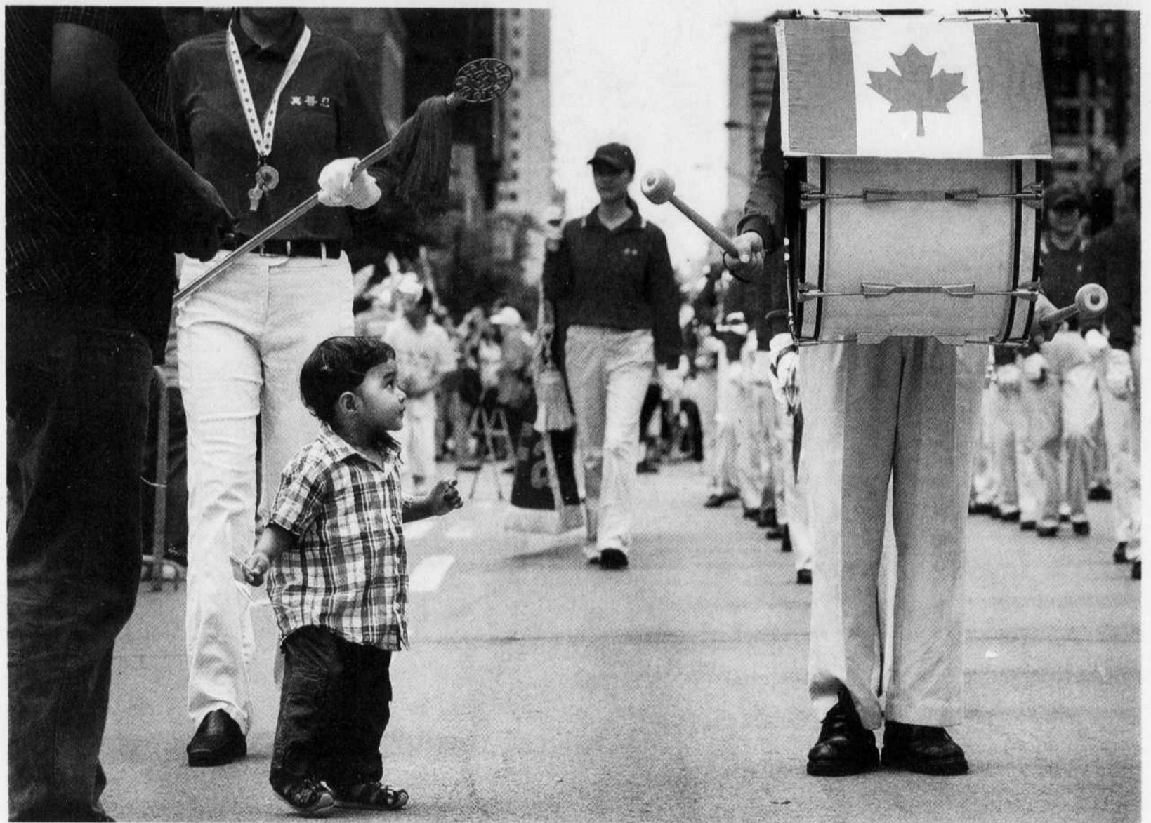
L'homme au tambour a semblé impressionner cet enfant, hier à Montréal, à l'occasion du défilé du 1 er juillet.