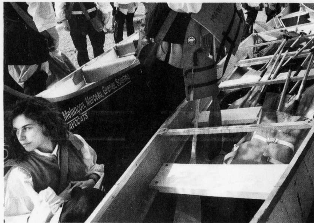
Deux canots rabaskas ont été mis à l'eau, hier matin au quai du Vieux-Port à Montréal, avec à leur bord des coureurs de bois et leurs guides amérindiens en costumes d'époque. Les équipages partaient de la métropole pour un périple de 119 kilomètres qui doit les mener à Trois-Rivières, samedi, à temps pour les festivités du 375 e anniversaire de fondation de la ville. Le maire de Montréal, Gérald Tremblay, et son homologue de Trois-Rivières, Yves Lévesque, ont assisté au départ des voyageurs qui feront des arrêts à Verchères, Sorel-Tracy et Yamachiche.