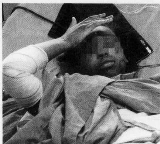
L'unique rescapée de la tragédie