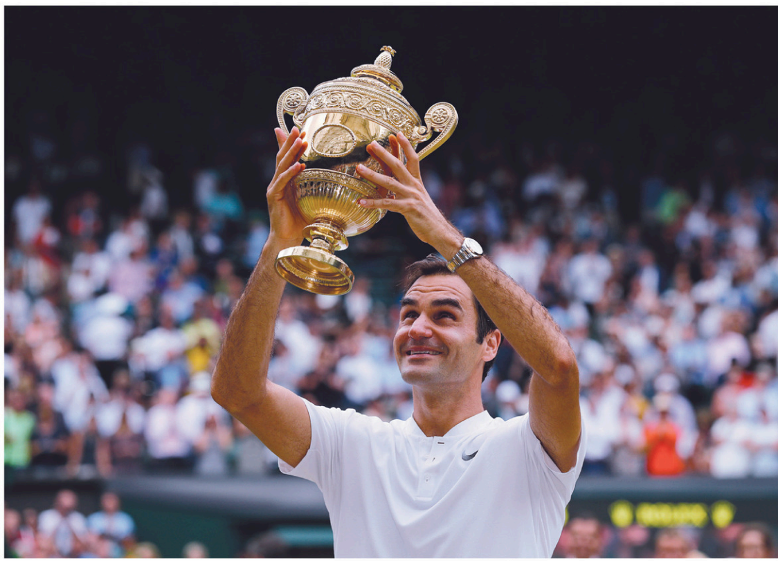
Roger Federer a remporté dimanche son huitième titre de Wimbledon en carrière.