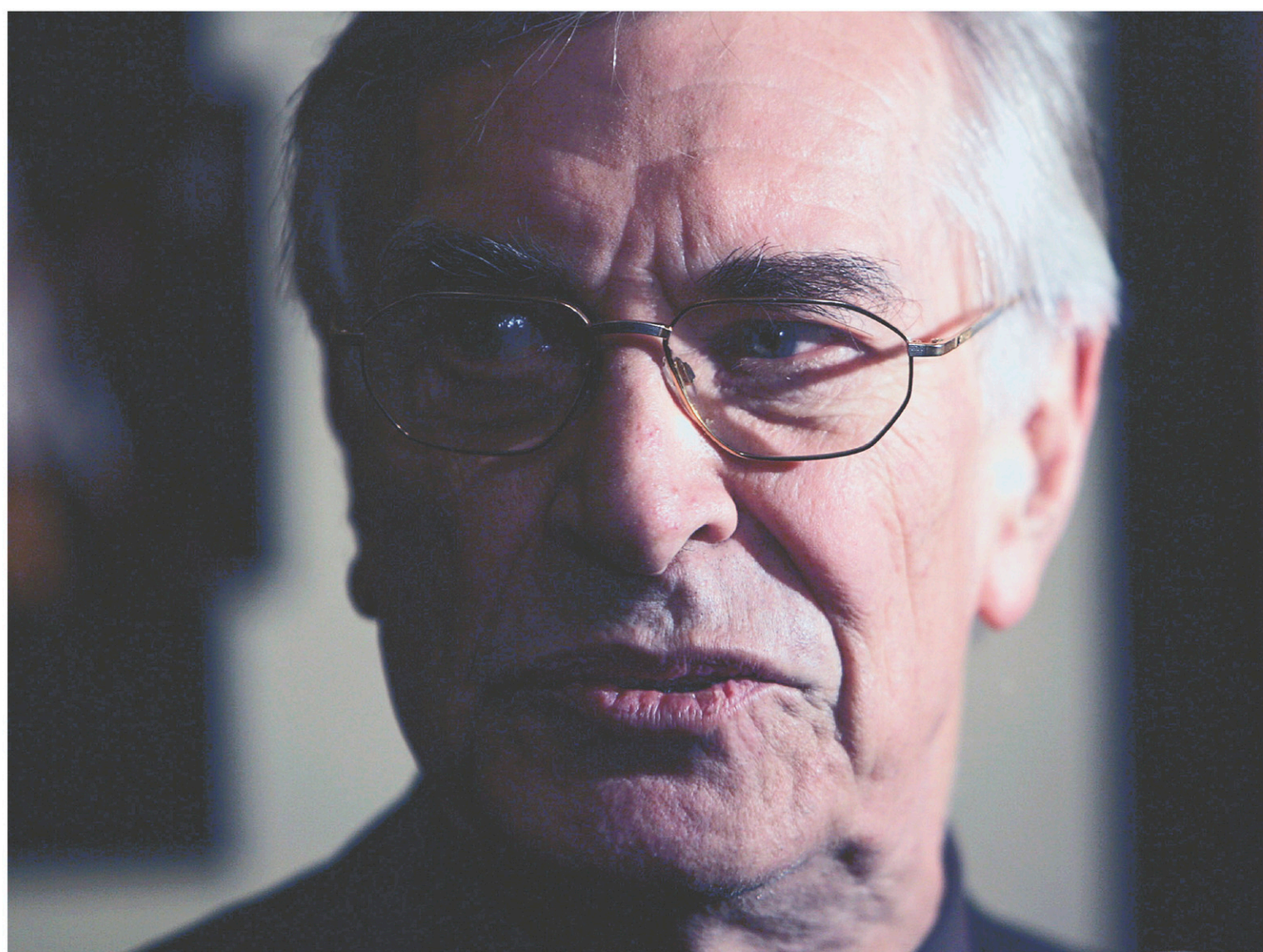
L'acteur Martin Landau photographié en 2004 à Beverly Hills