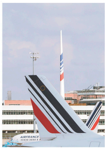
Les salariés de l'entreprise ont accepté le lancement d'une compagnie à coûts réduits.