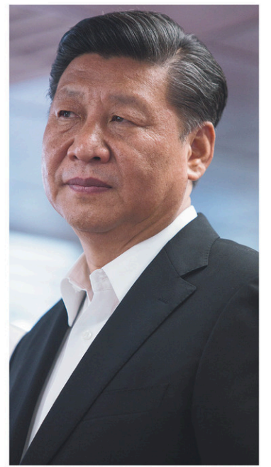
Le président chinois Xi Jinping