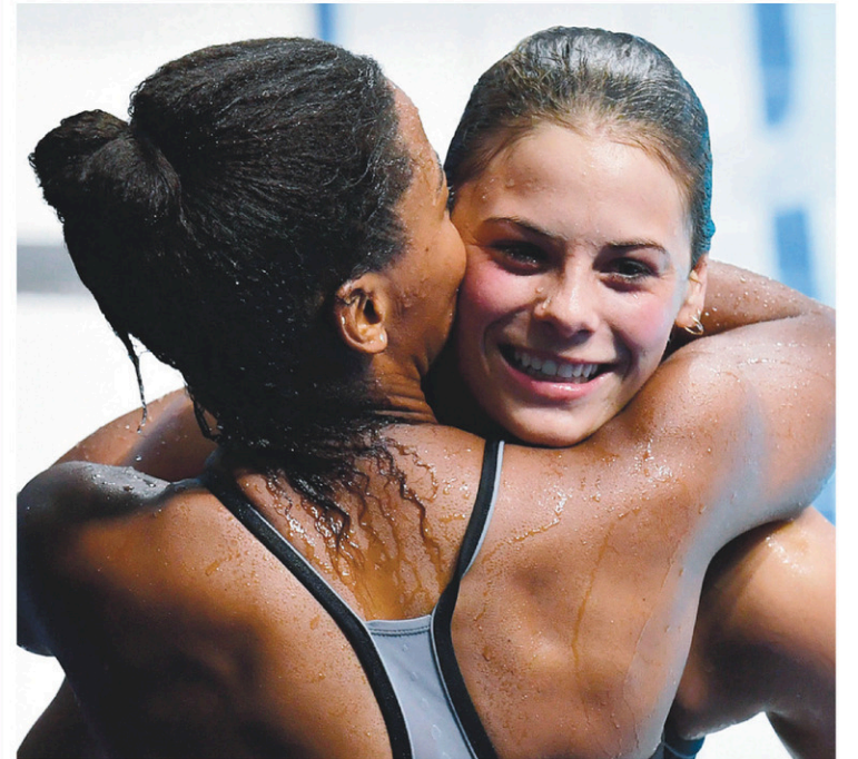
Citrini-Beaulieu (à droite) et Abel étaient visiblement ravies à l'annonce du pointage lundi.

Téléphone : 514 985-3322 Télécopieur : 514 985-3340