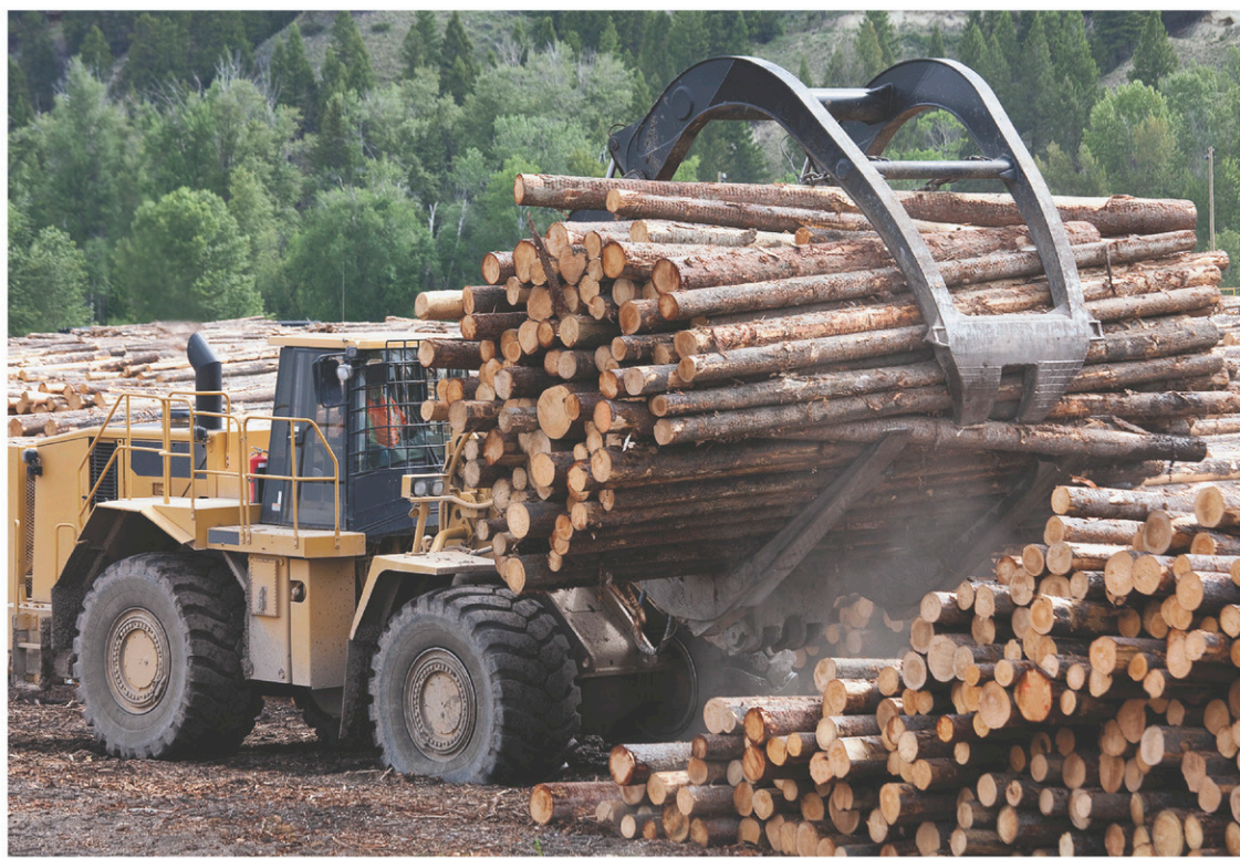
En mettant la main sur Tembec, Rayonier Advanced Materials pourra bonifier ses activités de cellulose, complémentaires à celles de la société québécoise, tout en se diversifiant avec l'ajout des secteurs des produits forestiers, des pâtes et des papiers.

L'offre initiale représentait une prime de 37%. Cette offre est toutefois inférieure au prix actuel de l'action de Tembec,