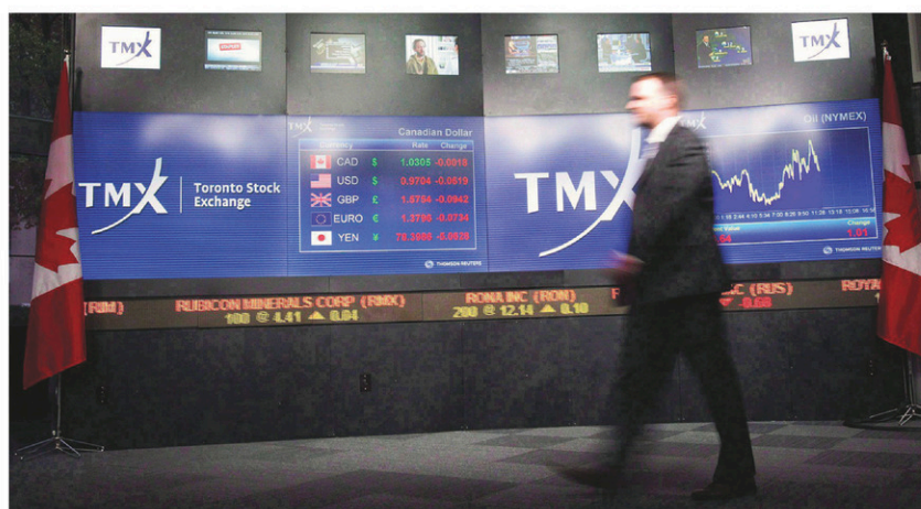
Les marchés boursiers de Toronto et de New York ont terminé la séance dans une relative stabilité.

De son côté, le dollar canadien a affiché un cours moyen de 78,93¢ US, en hausse de deux centièmes par rapport à celui de vendredi dernier. Le huard a pris près de 1¢ US complet la semaine dernière, après que la Banque du Canada a haussé son taux d'intérêt directeur pour la première fois