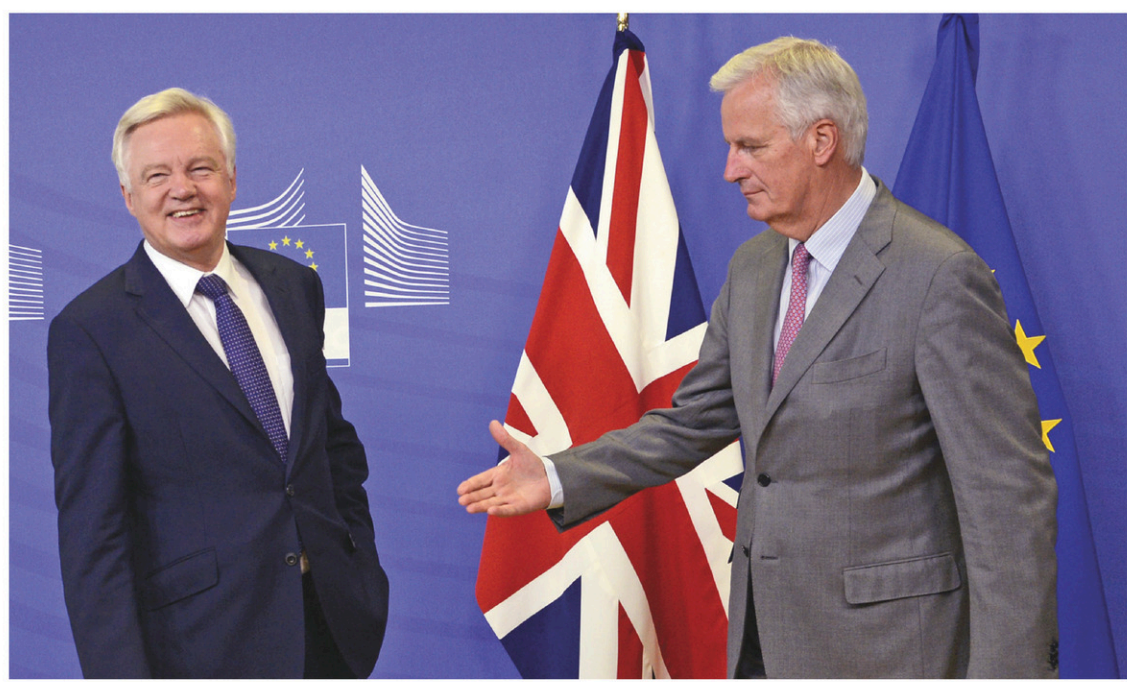
Le négociateur britannique responsable du Brexit, David Davis (à gauche), et le négociateur en chef de l'UE, Michel Barnier, se sont rencontrés lundi à Bruxelles.

Bruxelles — Les pays de l'UE se sont dotés lundi de nouvelles règles pour pouvoir empêcher l'exportation vers la Libye de canots gonflables et moteurs hors-bord utilisés par les migrants cherchant à rejoindre l'Europe par la Méditerranée.