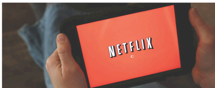
Netflix compte 104 millions d'abonnés à travers le monde.

Netflix a annoncé lundi avoir accueilli 5,2 millions d'abonnés à