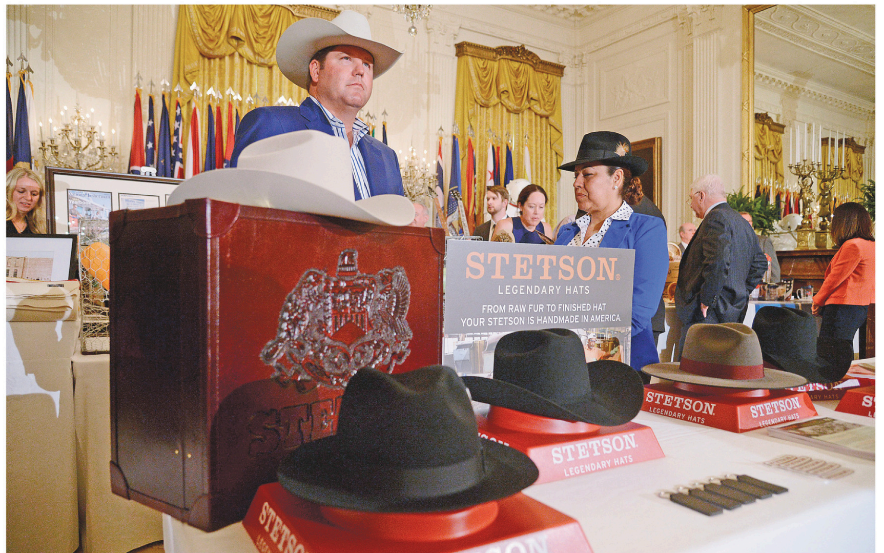
Le président Trump a reçu, à la Maison-Blanche lundi 50 entreprises provenant des 50 États américains pour mousser une campagne intitulée «Made in America», quelques heures avant la publication des objectifs de négociation.

Le prix de vente moyen d'une maison à travers le Canada s'élève à 504 458$, soit 0,4% de hausse par rapport à l'année précédente.