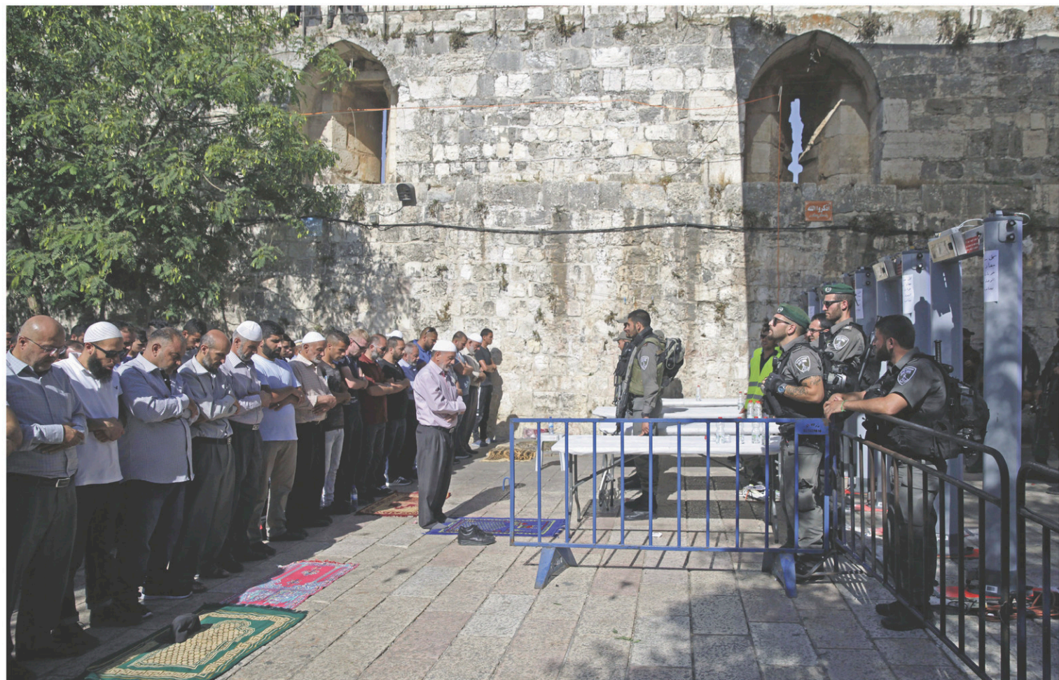
Comme dimanche, des centaines de musulmans ont prié à l'extérieur de deux des entrées du site pour protester contre l'installation des détecteurs de métal.