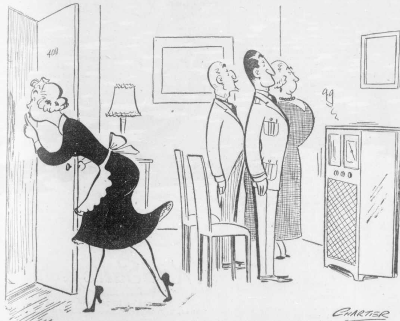
« Sh-h-h, la Reine chante... la Reine de la Radio 1949... »

On se rend compte de l'importance de cette nouvelle et il ne fait pas de doute qu'elle réjouira des milliers d'auditeurs. Nous tiendrons le public au courant des développements de cette intéressante innovation.