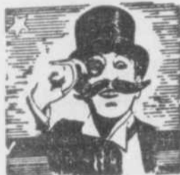
— PAR — L'ACADEMICIEN