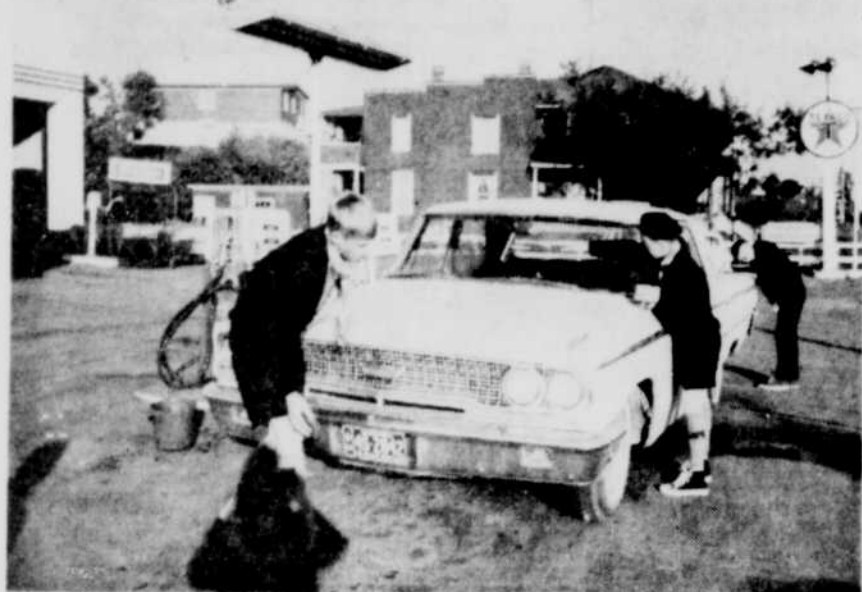
SERVIR — Tel est le mot d'ordre des scouts. Les scouts de Windsor le mettent à exécution tout en espérant ainsi se faire quelques fonds pour leur prochain camp d'été.

L'objectif de la journée d'étude était d'approfondir les chapitres LV et V de la Constitution dogmatique de l'Eglise, à savoir: "Le rôle du laïc dans l'Eglise et la vocation universelle de la sainteté".