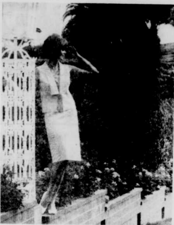
DEFILE — Ce magnifique ensemble de tissus Arnel fait partie de la collection qui sera montrée au cours du défilé de modes organisé par la Canadian Celanese, pour samedi prochain le 12 juin, dans le cadre du 150e anniversaire. La parade sera aussi marquée d'une démonstration de danse. L'entrée est libre.