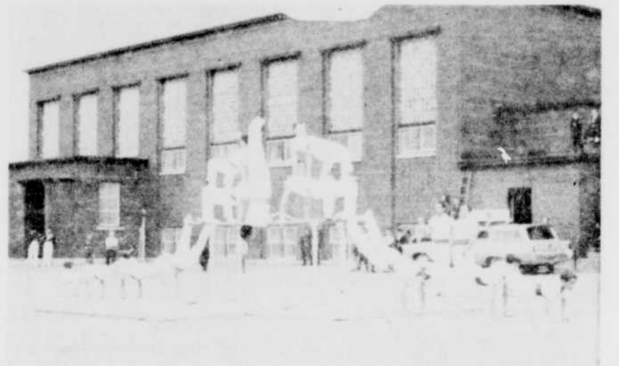
ARABESQUES HUMAINES — C'est dans des figures de ce style que se montreront les athlètes qui participeront ce soir, au gala de gymnastique qui sera présenté au Centre Mgr Bonin.

fité des services des Salutiens. Un don est donc un prêt pour un rendu.