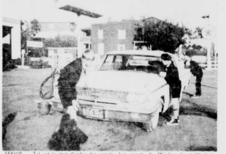
SERVIR — Tel est le mot d'ordre des scouts. Les scouts de Windsor le mettent à exécution tout en espérant ainsi se faire quelques fonds pour leur prochain camp d'été. Hier soir, ils étaient installés dans tous les garages de Windsor. Pendant que l'automobiliste faisait le plein en gasoline, ils lavaient les pare-brise et glaces des portières. Encore aujourd'hui, ils continueront leur travail toute la journée. En retour de ce service, les scouts tendent une boîte scellée... Pourquoi ne pas les encourager ?

Selon le secrétaire de la Commission scolaire, deux feuillets de mise en nomination ont été demandés. Il se pourrait également, d'après des bruits qui circulent dans la ville, que d'autres candidats soient intéressés à la chaise scolaire.