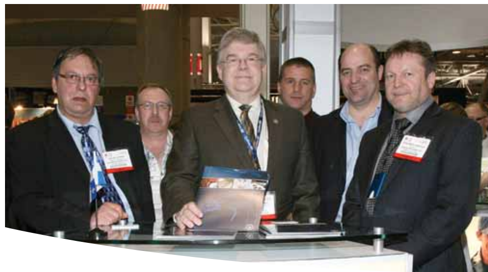
Le ministre de l'Agriculture, des Pêcheries et de l'Alimentation, M. Pierre Corbeil, en compagnie de membres de l'entreprise Unipêche MDM inc., située à Paspébiac en Gaspésie. L'entreprise exporte du crabe des neiges sous la marque de commerce Aristocrat.

Prochaine activité commerciale : 11, 12 et 13 mai 2011 Salon international de l'alimentation (SIAL), à Toronto