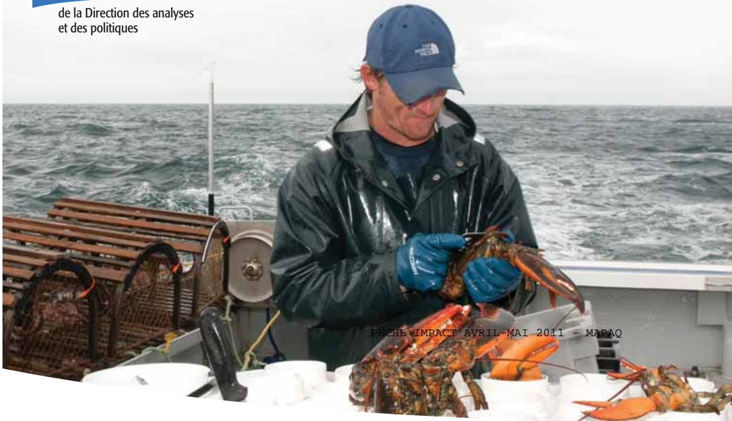
PÊCHE IMPACT AVRIL-MAI 2011 - MAPAQ

de la Direction des analyses et des politiques