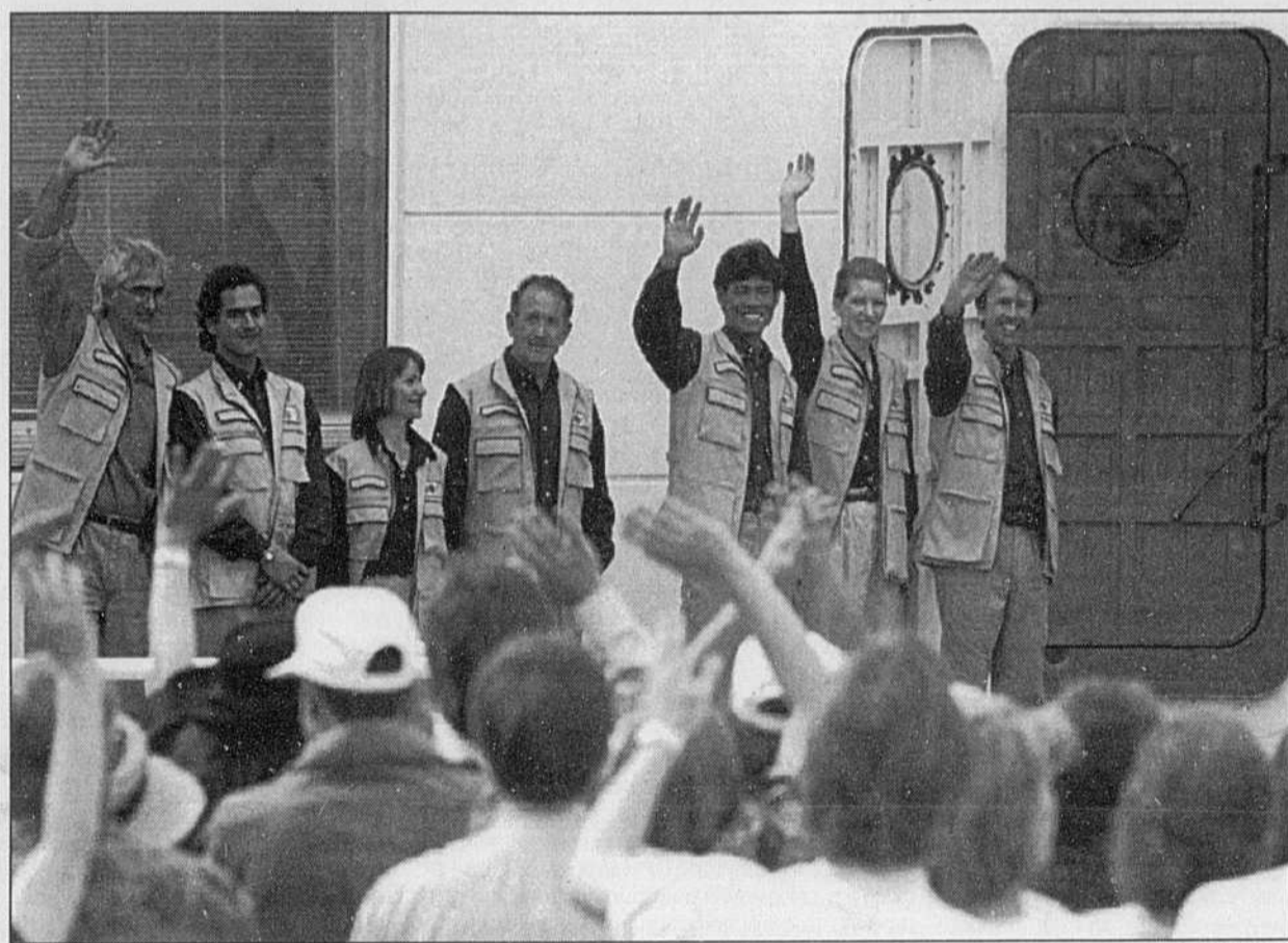
Devant des centaines de spectateurs, les sept participants, vêtus d'uniformes kaki, ont pénétré dans Biosphère 2 où ils séjourneront pendant les dix prochains mois.

Mais des combats, elle en a bel et bien perdus. L'actrice devenue ministre de la Culture n'a pu empêcher le déclin du cinéma national bouffé tout cru par Hollywood. Elle n'a pu obtenir la restitution des fameuses frises du Parthénon, propriété du British Museum depuis 1806, dont elle a demandé haut, fort et vainement la restitution au Musée de l'Acropole. Ni à obtenir pour Athènes la tenue des Olympiades d'or en 1996. Son dernier combat fut pour boycotter la reconnaissance de la république de Macédoine, à jamais grecque pour elle. Son hellénisme fut total, souvent ombrageux, parfois sectaire, toujours passionné. Cette semaine, au-delà des querelles partisans, au-delà des camps politiques, toute la Grèce est en noir.