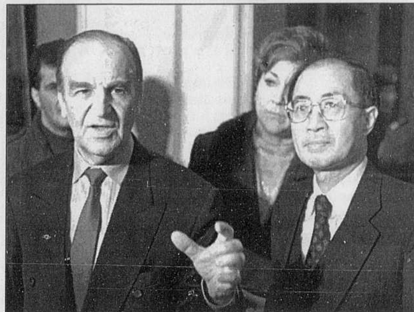
Le président bosniaque, Alija Izetbegovic, a reçu hier à Sarajevo le représentant spécial de l'ONU dans l'ex-Yougoslavie, Yasushi Akashi.

Si ces informations ont redonné espoir de secourir la population civile de Bosnie centrale coupée du