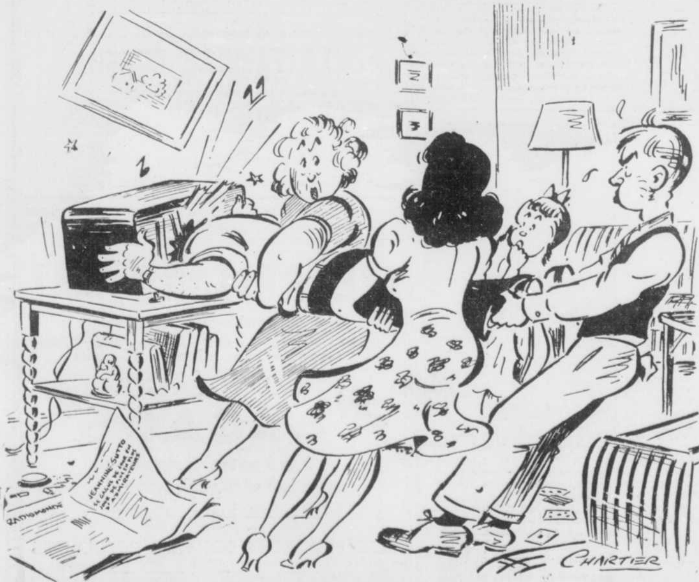
"Il est tellement emballé de JANINE SUTTO que c'est comme ça chaque fois qu'il l'entend au micro!"