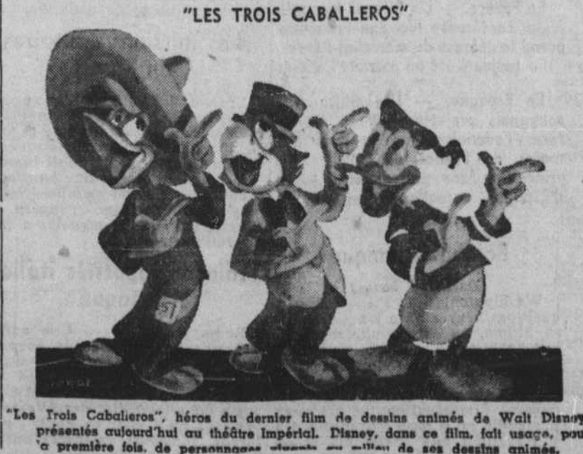
"Les Trois Caballeros", héros du dernier film de dessins animés de Walt Disney présentés aujourd'hui au théâtre Impérial. Disney, dans ce film, fait usage, pour la première fois, de personnages vivants juxtaposés à ses dessins animés.