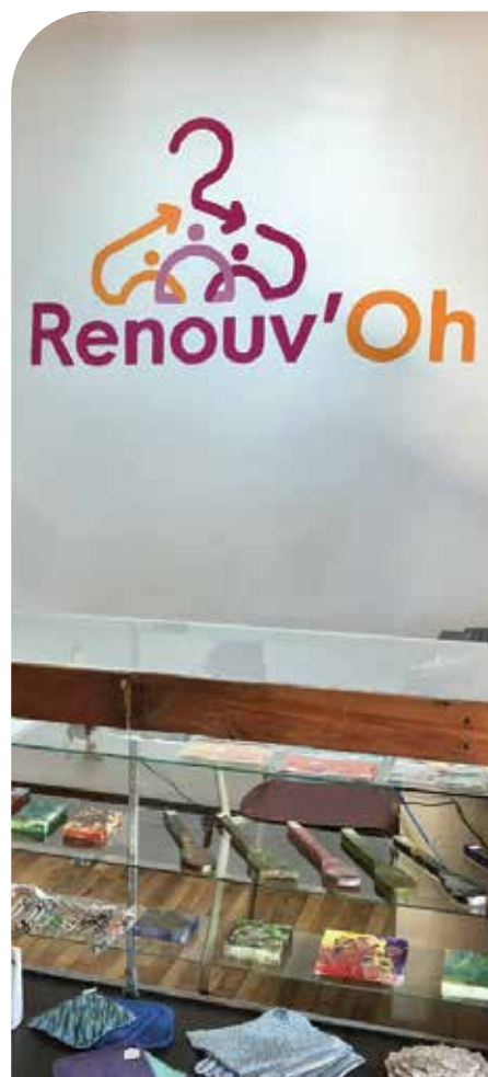
Depuis déjà deux mois que bat un nouveau cœur dans la municipalité de Saint-André-Avellin : Renouv'Oh.