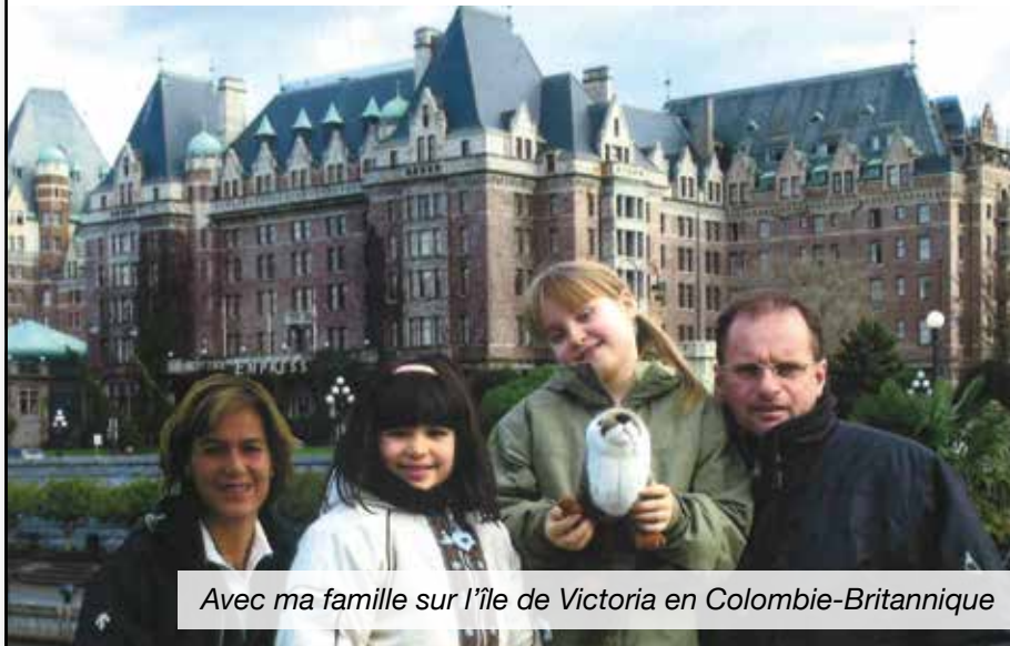
Avec ma famille sur l'île de Victoria en Colombie-Britannique