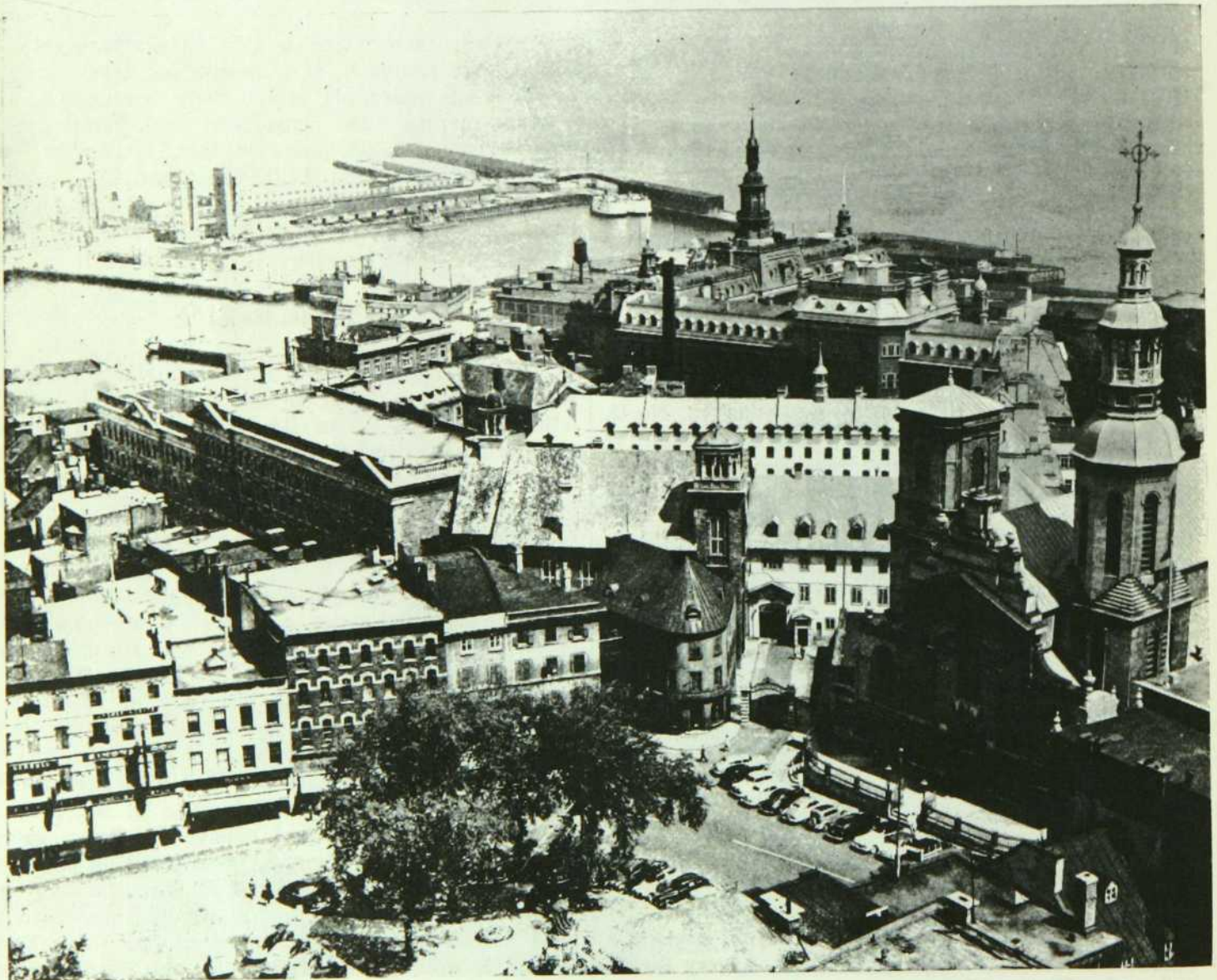
UNE PARTIE DU VIEUX QUEBEC

Quebec City, the population of which exceeds 165,000, will attain in the relatively near future, according to the present rate of increase, 200,000.