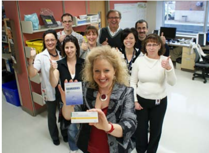
L'équipe de la pharmacie du CHRTR conserve les doses de vaccins, de Tamiflu, et de Relenza et agit à titre de centre de distribution pour la région immédiate de Trois-Rivières.